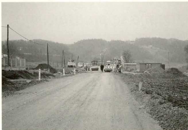
V gradnji je tudi cesta Stogovci-Slape. Novo asfaltno cestno prevleko naj bi cesta dobila do pomladi.