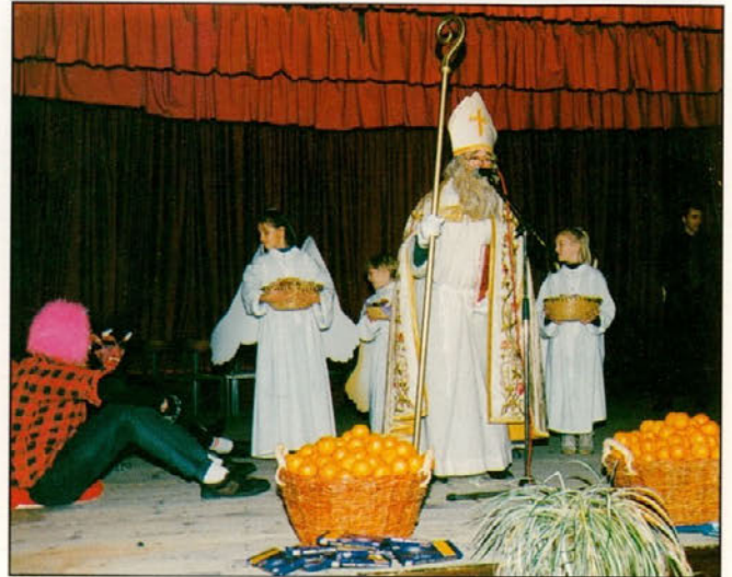
Med otroci v Majšperku parkeljni niso imeli dela. Bo že držalo, da so otroci tod naokoli dovolj pridni in ubogljivi.

In kdo je pravzaprav svetnik, ki tako skrbno že vrsto let obdaruje otroke? Legendarni junak se navezuje na živo osebo, škofa Nikolaja iz Mirne v Likiji (zdaj Turčija), ki je umrl v 4. stoletju. Pozneje naj bi njegove ostanke prenesli v italijanski Bari. Od 11. stoletja naprej je Miklavževa priljubljenost izjemno narasla. Ime izvira iz latinskega Nicolaus, to pa iz sestavljenega grškega Nikolaus, kar pomeni "Zmaga v boju" in "Narod, ljudstvo". V obliki Nikolaj je pri nas izpričano iz leta 1213 v Izoli (Nicolaus). Oblika Miklavž je najbrž nastala v 14. stoletju. V cerkvi je bil ta svetnik v časteh kot velik priprošnjik in čudodelnik, okrog katerega se je spletla vrsta legend. Prav zato je zaščitnik kakšnih 35 poklicev, pomočnik v različnih tegobah in patron mnogih držav in dežel.