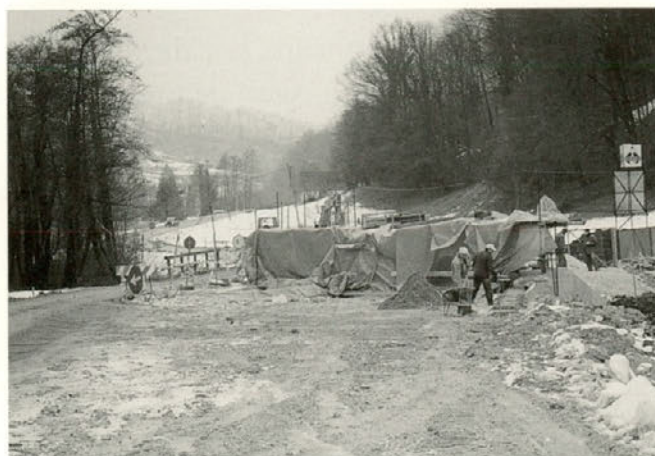
Na cesti, ki vodi iz Majšperka do Rogatca je v gradnji že drugi most — tokrat v Zgornji Sveči. Na posnetku delavci Gradisa v polni gradnji.

V mesecu juliju letošnjega leta smo odprli novi most čez reko Dravinjo na cesti Rogatec — Majšperk. Sedaj pa je že na isti cesti v gradnji novi most čez Skralško v Zg. Sveči. Tudi tokrat je izvajalec del, po naročilu Direkcije za ceste Republike Slovenije, Gradis iz Celja.