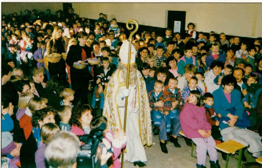
Svečan prihod svetega Miklavža so spremljale mnoge radovedne otroške oči, za njim pa je pogledala tudi marsikatera mamica.

Pri organizaciji prireditve, ki tako mladeži kot starejšim vzbudi prijetne spomine, so tudi letos na pomoč priskočili številni sponzorji in donatorji. Blizu 50 se jih je nabralo vseh skupaj. Vsak je pač prispeval po svojih zmožnostih in prav vsem naj še enkrat velja iskrena hvala. Posebna zahvala pa velja tudi aktivu kmečkih žena iz Majšperka, ki so obiskovalce pogostile s okusnim drobnim pecivom.