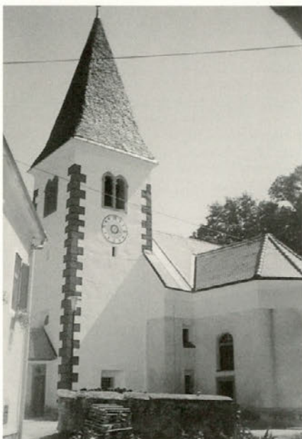
Podoba obnovljene majšperske cerkve — ponos in središče Majšperka

Cerkev se omenja v do sedaj znanih virih že pred letom 1400, prvotna cerkev ali kapela pa je bila verjetno grajena še pred tem letom, saj o tem pričajo vidne dozidave. V vseh vizitacijski zapisih se omenja ta cerkev, kot revna