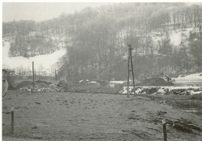
Regulacija Dravinje pod mostom v Slapah – december 1996