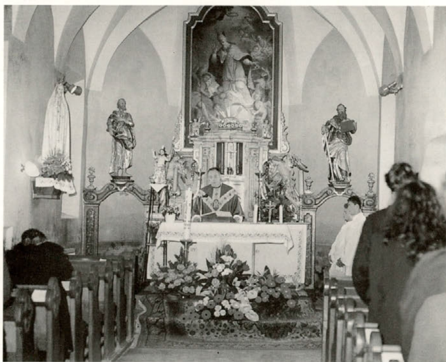
Cerkev je posvečena sv. Miklavžu, na glavnem oltarju je slika zavetnika cerkve in fare, delo je neznanega avtorja. Od prvotnih petih oltarjev, so ostali samo trije in še ti so zelo osiromašeni.

ne, tako da manjka mnogo podatkov, ki bi lahko koristili pri iskanju podatkov o župniji in cerkvi. Letnica 1609 je omenjena na krstnem kamnu. Na podboju kamnitih vhodnih vrat pa je letnica IBS 1639, verjetno pa je bila tak-