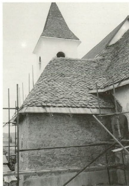
Obnova podružnične cerkve sv. Bolfenka na Jelovicah