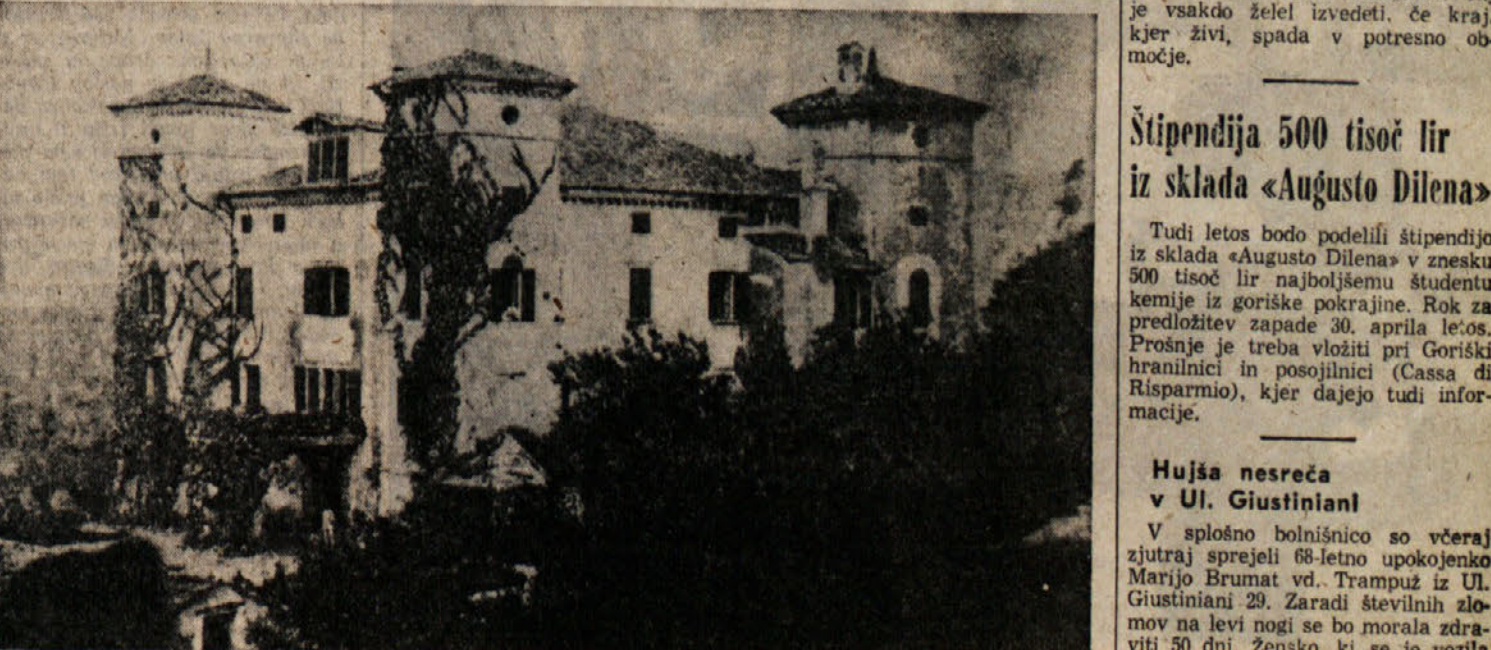
«Skupina 77» iz Sovodni se je odločila izdati zbirko razglednic naših krajev na Goriskem. Poleg novih posnetkov bodo ponovno tiskali tudi nekaj starih razglednic, ki so jih našli v arhivih in zasebnih zbirkah. Med zgodovinske posnetke sodi tudi gornji, ki prikazuje Rubijski grad pred prvo svetovno vojno