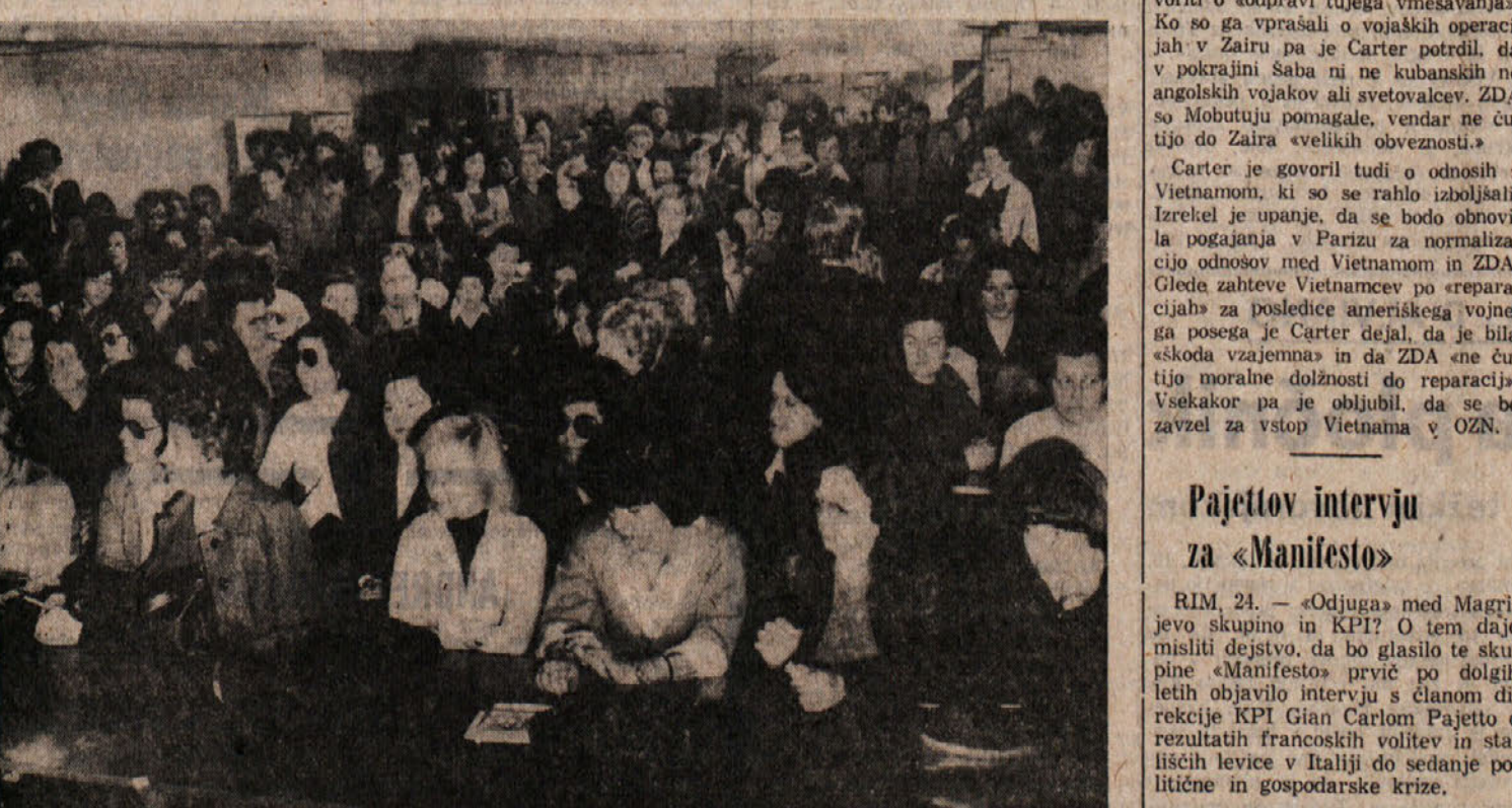
V tovarni Calza Bloch v tržski industrijski coni je bilo včeraj množično zborovanje vseh štirih obratov Calza Bloch v Italiji, na katerem so razpravljali o izredno kritičnem stanju in o težkih pogojih uslužbencev, ki se tri mesece ne prejema plače; na sliki: delavke med včerajšnjim zborovanjem. Obširno poročilo berite na drugi strani