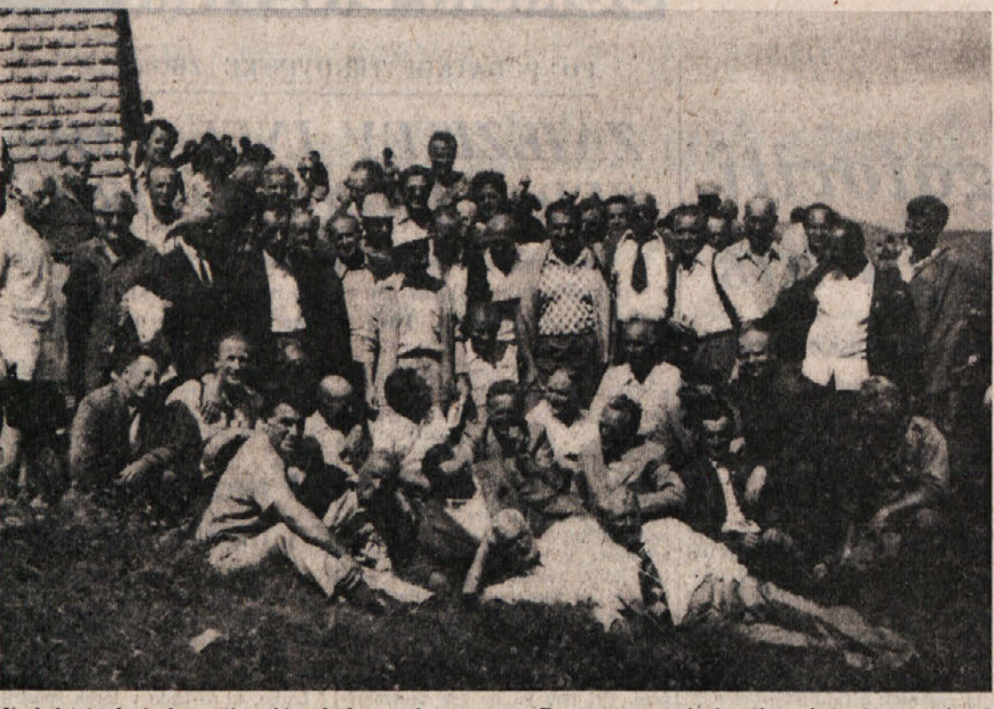
Vsakoletni planinsko-partizanski pohod na vrh ponosnega Porezna v spomin junaškega boja, ki so ga borci Kosovele brigade bili 24. marca 1945 proti številno nadmočnemu nacističnemu sovražniku, je postal že prava tradicija. Letos se bodo bivši borci, planinci in mladina podali na ta najvišji vrh Juljskega predgorja (1632 m) prihodnjo nedeljo že ob 7. uri zjutraj in sicer iz Cerklje. Na sliki: udeleženci pohoda v lanskem letu. Med njimi je opaziti več bivših borcev s Trzaskega.

Pohod na Porezen je organiziran pod strokovnim vodstvom ter je z jamčeno varnostjo udeleženec. Pohod na Porezen je organiziran pod strokovnim vodstvom ter je z jamčeno varnostjo udeleženec.