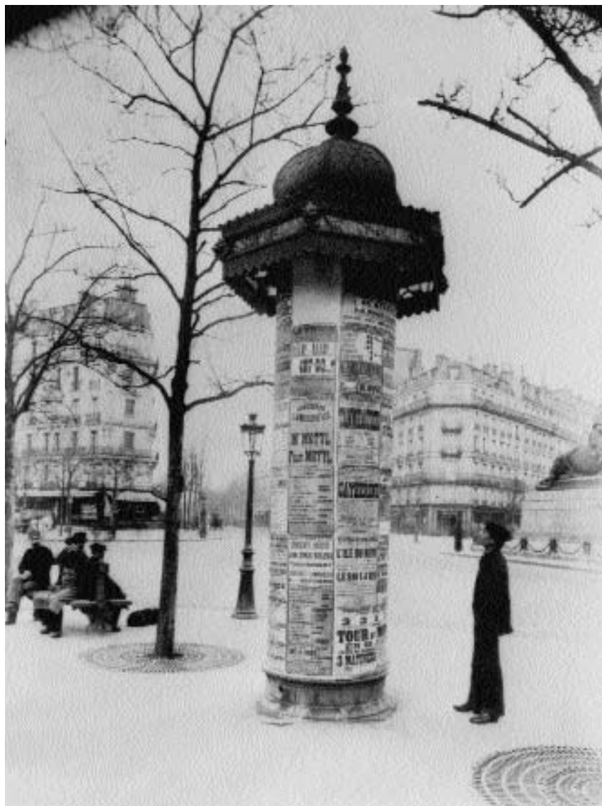
4. Eugène Atget: Oglasni stolpič, trg Denfert-Rochereau, Pariz 14, 1898–1900