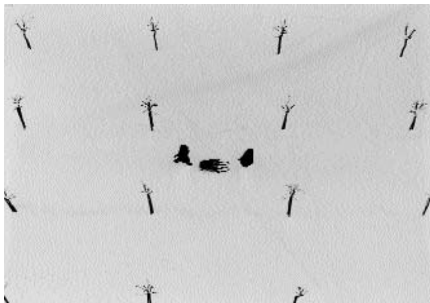
3. Janez Marenčič: Ornament , 1956, Ljubljana, Moderna galerija