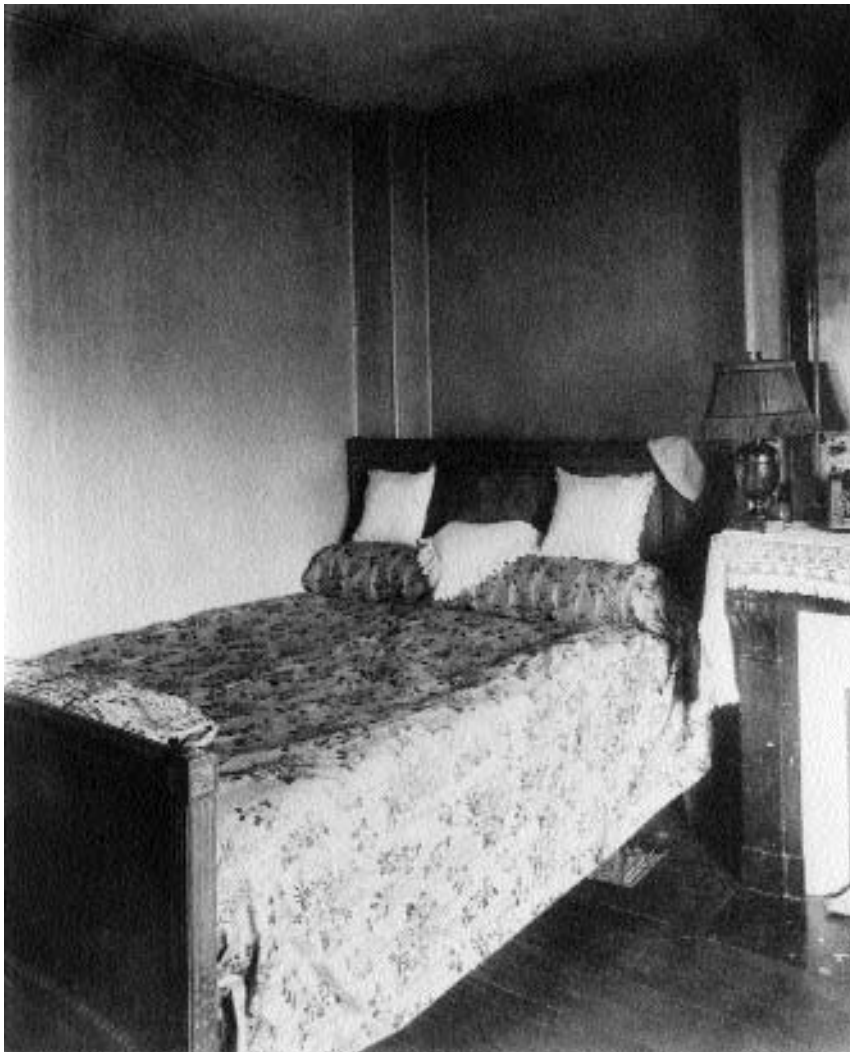
5. Eugène Atget: Dekoraterjevo stanovanje, Rue du Montparnasse, Paris 6 ali 14, 1910