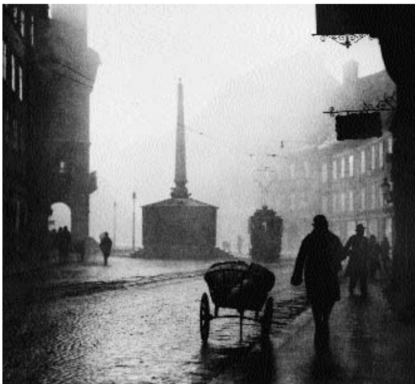
1. Fran Krašovec: Ljubljana jeseni , 1930, Ljubljana, Moderna galerija

dolžnega« ali »eidetskega« stanja fotografije. »Edina 'objektivna' resnica, ki jo fotografija ponuja, je trditev, da je nekdo ali nekaj – v tem primeru neki fotografski aparat – nekje bil in naredil posnetek. Vse drugo, vse, kar se zgodi potem, ko je bil zapis narejen, se ponuja interpretaciji.« 17 Neupoštevanje te bistvene razsežnosti narave fotografije, namreč, da fotografija ni magična emanacija, nekakšna »alkemija«, pač pa materialni produkt, ki deluje v specifičnem kontekstu z bolj ali manj definiranimi nameni, da je torej narava njenega sporočila dogovorjena, je pravzaprav vzrok za manipulacije s pomenom fotografije. Takšno ravnanje pa je primer, ki že ponazarja delovanje arhiva samega.