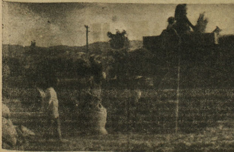
Mlatilnica na Cesti pri Ajdovščini melje z polno paro

Vse sile za V. Kongres KPJ! Stab II. Goriške MDB „Franceta Perovška“.