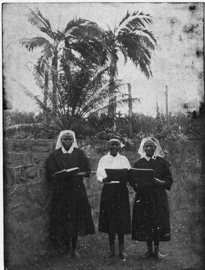
Zamorska dekleta, ki se pripravljajo na redovniški in misijonski poklic.

Prosim, molite, da skoro izide zarja tudi tem rodovom, katere objema še tema paganstva in so v nevarnosti, da