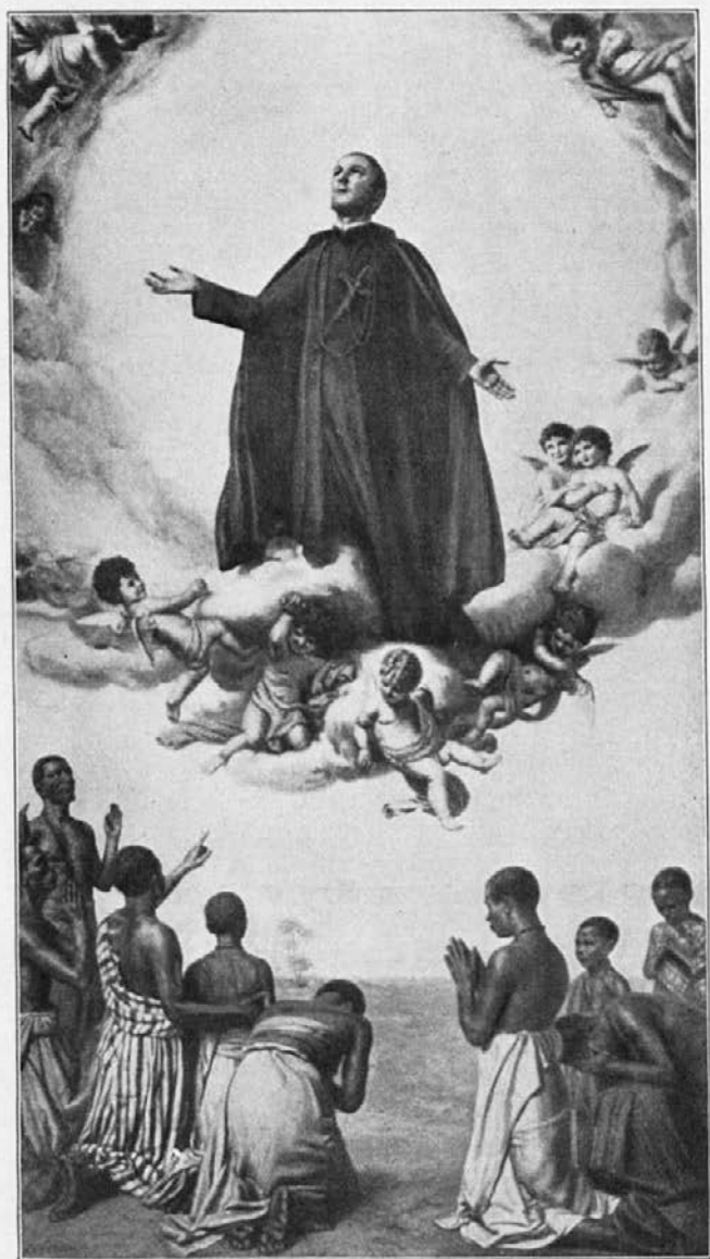
Sv. Peter Klaver, apostol zamorcev.