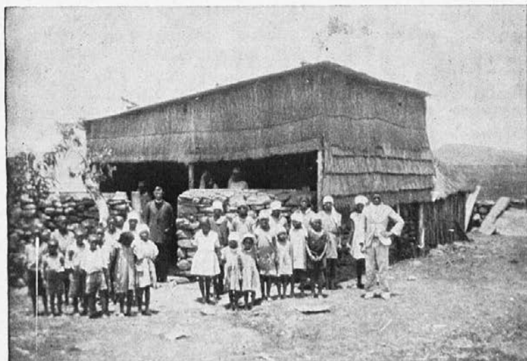
P. Moršer s svojimi učenci in katehistom pred šolo.

Ničesar, da bi postavil misijonsko cerkvico in šolo, katero tako zelo potrebujemo. Ker če nimam cerkve in šole, so uspehi le slabi.