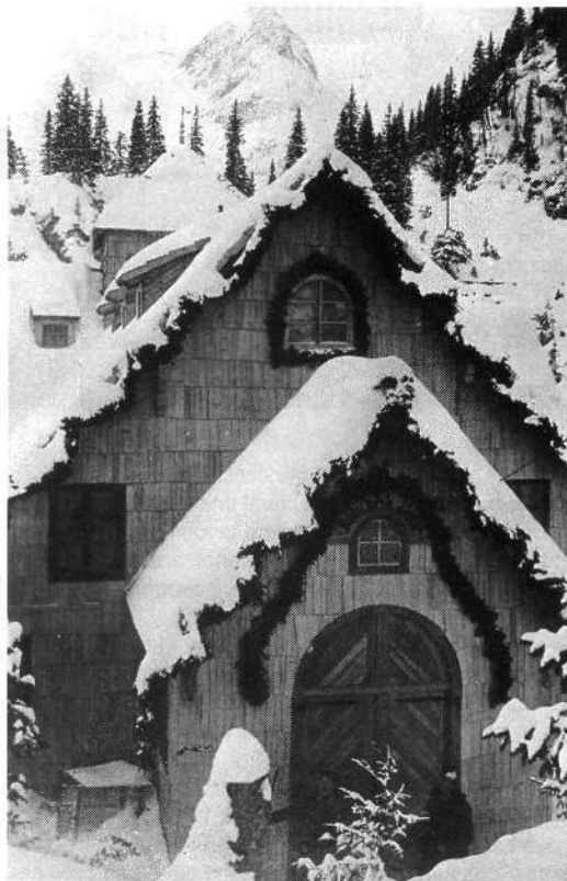
»Izdajalski« posnetek vhoda v kinodvorano Rohrbeck Halle na planini Duplje: nad njo se vidi vrh Velikega Smohorja (1939 m).