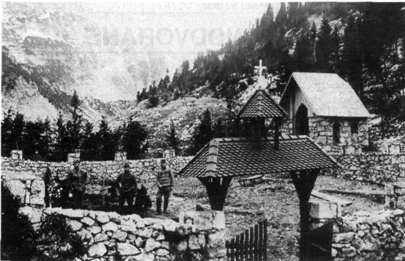
Vojaško pokopališče s kapele na pobočju nad sedanjo ovčarijo na planini Duplje.

območja planine Duplje preživel celo zimo 1915/16. Medtem ko je del vojaštva čuval prvo linijo na Šmohorju in Lemežu, so ostali iz doline tvorili hrano, opremo in strelivo, pa tudi gradbeni material, saj so na planini Duplje gradili objekte velikega visokogorskega skladišča.