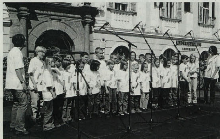
Nastopili so tudi otroci javne dvojezične ljudske šole v Celovcu