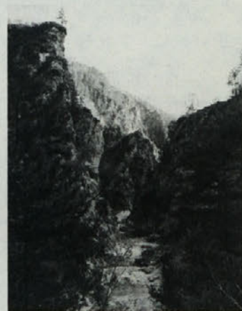
Naravne krasote korških peči