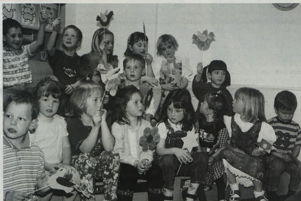
ZA MATERINSKI DAN – Za materinski dan so bile po vrtcih in društvih številne proslave. Tudi v Dvojezičnem vrtcu v Borovljah so vzgojiteljice in otroci pripravili dopoldan za matere in očete. V petek popoldne so jih presenetili z darovi (v mavce odtisnjena roka) ter s petjem in recitacijami. Pristrčna proslava je odsevala prijetno vzdušje, ki vlada v vrtcu ter soglasje med vzgojiteljicami in starši.

Berlusconi je koalicija »Hiša svoboščin« je z 42,7 % glasov prepričljivo zmagala v obeh domovih. »Oljka« je dobila 38,7 % glasov. Njen glavni kandidat Francesco Rutelli je napovedal »ostro opozicijo«.