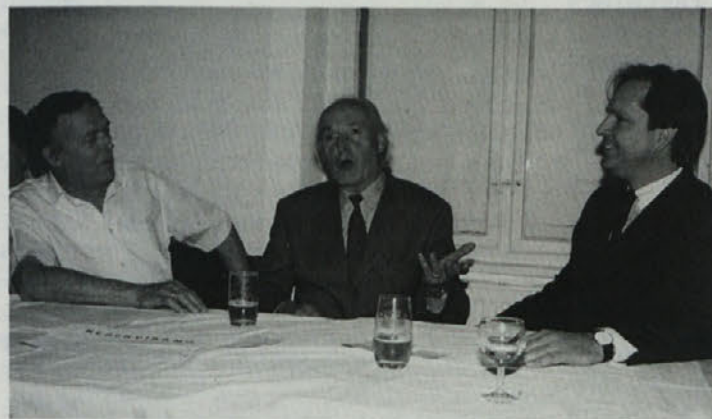
Kozarjevi puebi iz Ždovelj

Vigredni koncert, ki ga prireja KPD »Drava« v Žvabeku, že kar nekaj let uvaja v kulturno dejavnost slovenskih prosvetnih društev v pliberški in žvabeški okolici. Obenem pa je ta koncert lepa izkaznica bogatega in zagnanega kulturne-