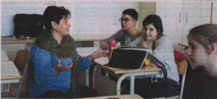
Gostje, člani slovenskih društev v Srbiji, so se na obisku v Postojni dobro počutili.