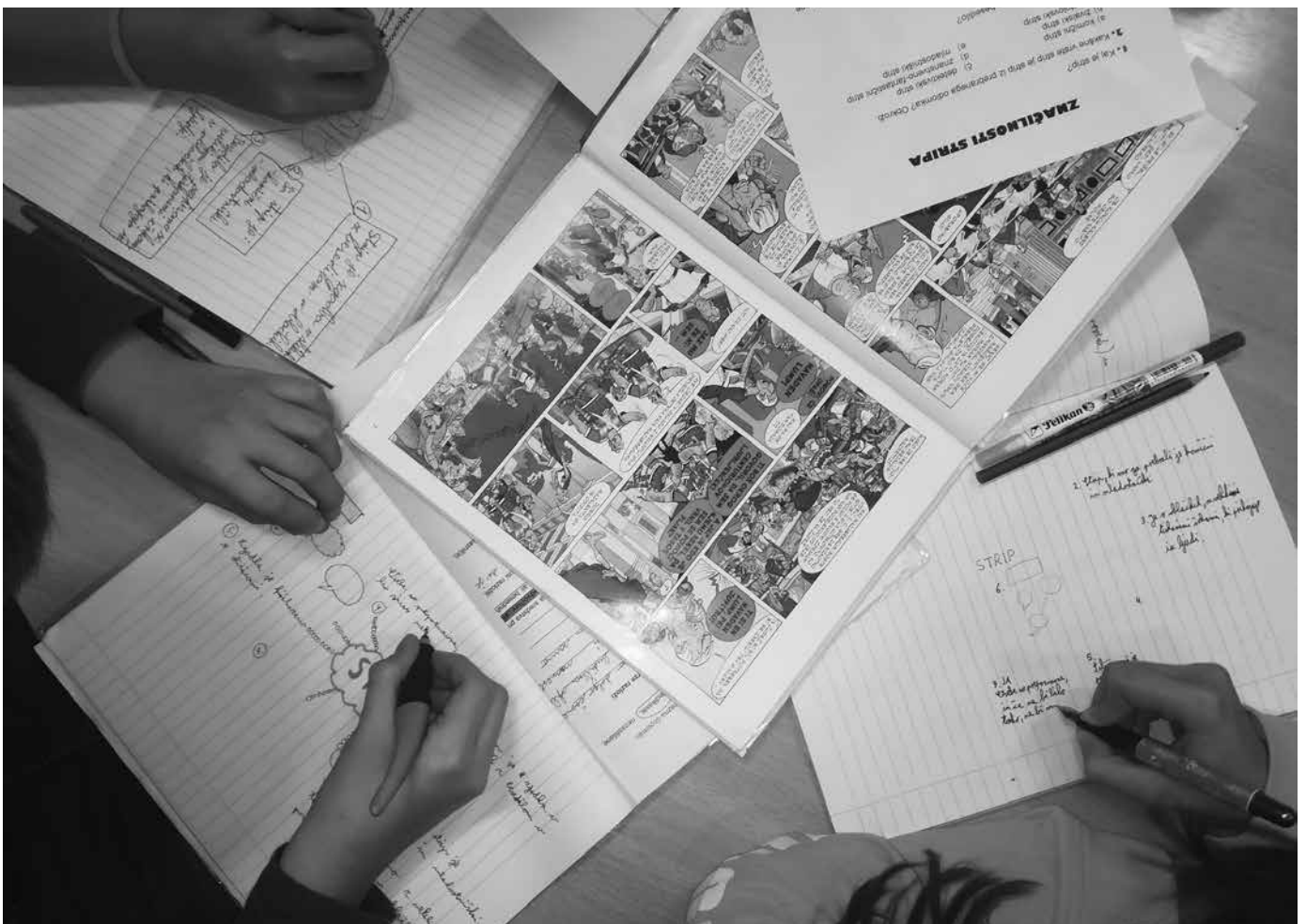
Slika 1: Delo v skupinah