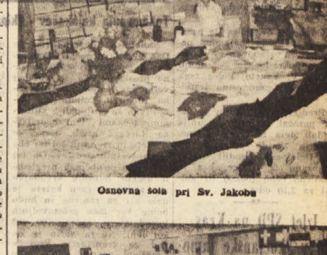
Osnovna šola pri Sv. Jakobu