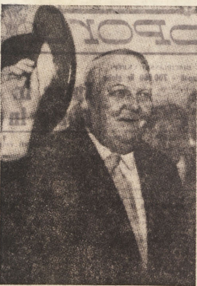
Ludwig Erhard, zahodnonemški gospodarski minister, se je vrnil iz ZDA. Takoj po povratku je dal dokaj polemične izjave. Zaradi neke okvare je njegovo letalo odletelo iz New Yorka s 6-urno zamudo; malo preden je pristalo v Dueseldorfu, pa je vanj tresčila strela