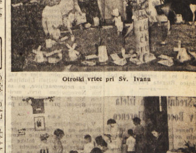
Otroški vrtec pri Sv. Ivanu