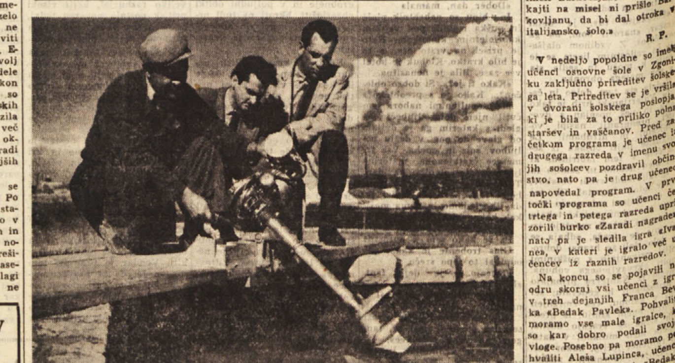
Konstruktorji tovarne TOMOS preizkušajo motor za male čolne «LAMO»

Pretekli teden so se mudili v tovarni «TOMOS» v Kopru 4 inženirji italijanske avtomobilske industrije «FIAT» iz Turina in si ogledali naprave za barvanje lakirnice. «TOMOS» namreč uporablja lake, ki so mnogo bolj od tistih, ki so jih do sedaj uporabljali in FIATovi inženirji sedaj žele v FIAT-ovih tovarnah upeljati lakiranje po izkušnjah in metodi, ki jo uporabljajo v Tomosovi tovarni v Kopru. Najnoviji izdelek TOMOS-ove tovarne, ki ga bodo sedaj začeli izdelovati serijsko je izvenladijski motor LAMO 05 K za čolne. Osnova motorja je motor Colibri iz katerega je nato izdelan LAMO motor, ki ima 49 cm jakosti z učinkom 2 KS in 2000 obrati v minuti. Letos bodo zaključili solanje sedaj vajenci iz tovarne TOMOS. Po triletni učni dobi bo tako naša industrija dobila tude prve kvalificirane delavce - orodjarje, ki so bili izučeni v domači tovarni. Konstruktorji Tomosove tovarne sedaj preizkušajo in stvarajo kakšne so možnosti za izdelavo avtomobila v tovarni. Nekaj izvenladijskih avtomobilskih tovarn namreč zelo oblega tovarno in ji nudijo vrhne ugodnosti za izdelavo avtomobila. Med temi so sedaj najprej Francozi, ki ne nudijo licence, temveč kooperacijo, pri izdelavi avtomobila. Po vsej verjetnosti se bo vodstvo tovarne odločilo za izdelavo avtomobilov ti-