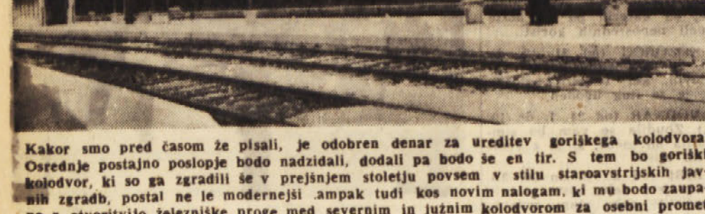
Kakor smo pred časom že pisali, je odobren denar za ureditev goriškega kolodvoza. Osrednje postajno poslopije bodo nadzidali, dodali pa bodo se en tr. S tem bo goriški kolodvor, ki so ga zgradili še v prejšnjem stoletju povsem v stilu staroavstrijskih javnih zgradb, postal ne le modernejši ampak tudi kos novim nalogam, ki mu bodo zaupali z igrivostjo železniške proge med severnim in južnim kolodvorom za osebni promet