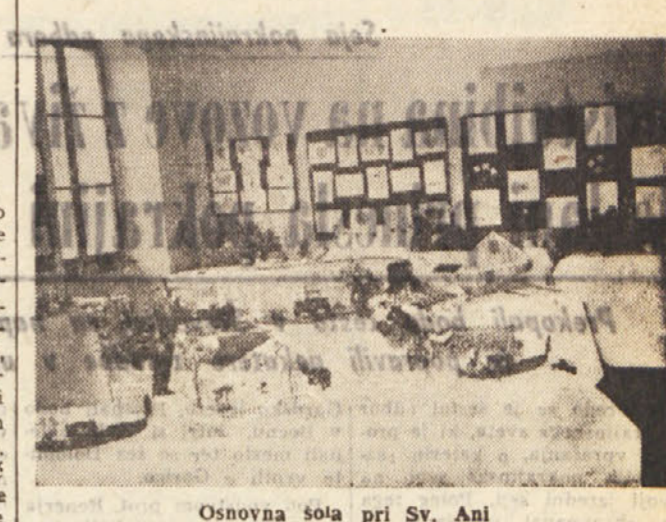
Osnovna šola pri Sv. Anli