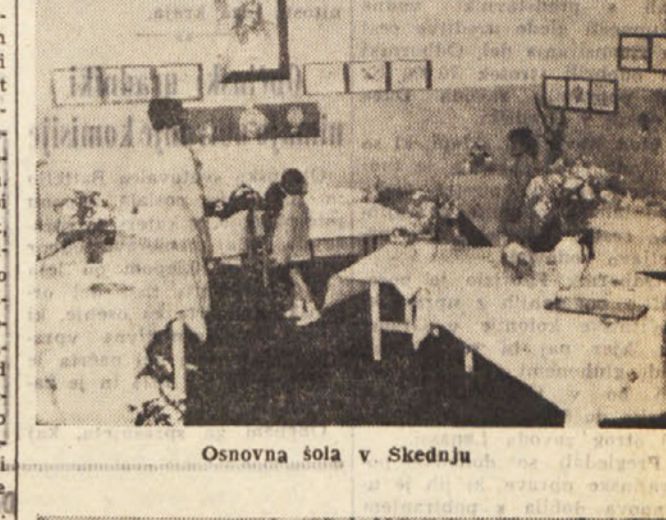
Osnovna šola v Skednju