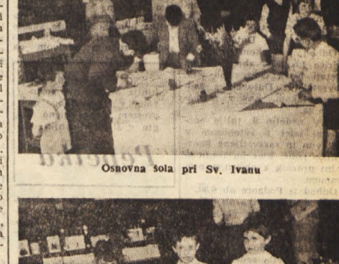
Osnovna šola pri Sv. Ivanu