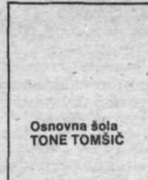
Osnovna šola TONE TOMŠIČ