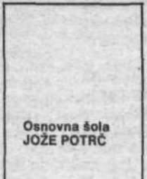
Osnovna šola JOŽE POTRČ