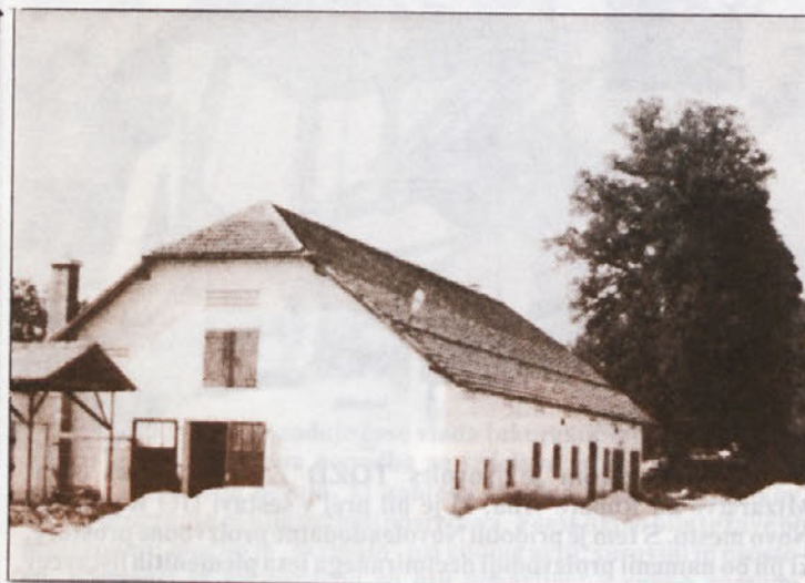
Obrat na Ruperč vrhu

Kočevski zbor odposlancev slovenskega naroda, ki je bil v oktobru 1943, je mejnik slovenske državnosti. Zbor je temelj državnosti in družbenopolitične ureditve, slovenske socialistične republike in naše samoupravne skupnosti. Na Kočevskem zboru so se prvič v zgodovini srečali svobodno izvoljeni odposlanci — delegati slovenskega ljudstva. Spomin na ta zbor, ki je pred 40 leti sredi najhujše vojne vihre in med najhujšim terorjem hitlerjanske nacistične Nemčije junaško ustvarjal državnost slovenskega naroda, nam je v sedanjih časih svetel zgled za premagovanje težav in vzpodbuda za nadaljnjo graditev naše družbe.