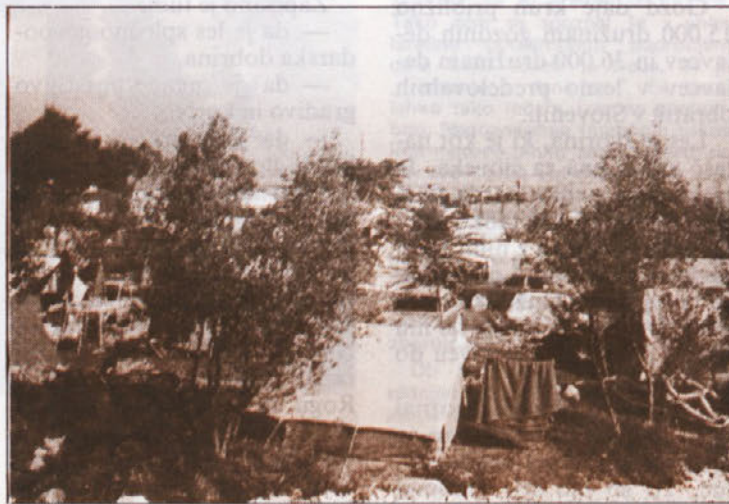
Kamp v Njivicah

Alkoholno propadanje pa gre medtem svojo pot in zapiti sodelavec ne more več sam nič proti temu, tudi če bi rad. Odvisnost je že daleč močnejša od njega. Če se njegova „dobra“ delovna skupina ne bo pravočasno osvestila in poučila o pametnem ravnanju z alkoholikom v delovnem razmerju, bo njihov sodelavec moral pač tako propasti, da mu ne bo več prave pomoči. Nesposoben za delo in za sožitje bo morda prek invalidskega postopka v najboljših letih pristal v onemoglem brezdelju na robu družbe.