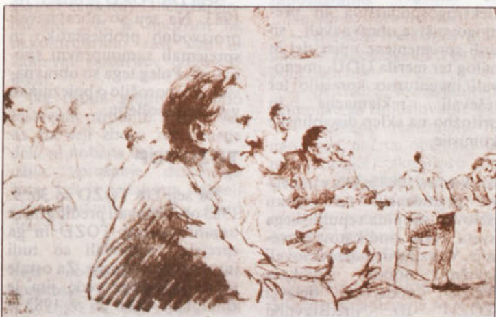
Zasedanje zbora odposlancev slovenskega naroda v Kočevju (risba Božidarja Jakca 1943)

Tudi v Novolesu se bliža čas obračunov, ki nam bodo že dajali prve orientacijske smernice, kako bomo letos zaključili poslovno leto in nas obenem spomnili, kako smo do sedaj gospodarili. Devetmesečni obračuni bodo znani sicer šele po 20. 10 1983, znani so pa že osemmesečni obračuni in izvozno uvozna gibanja, ki močno vplivajo na gibanje dohodka. Podatki zaenkrat kažejo dokaj ugodno sliko, saj le dve temeljni organizaciji izakuzjeta po delitvi dohodka negativni saldo, pa še ti dve sta vložili maksimalne napore za izboljšanje svojega ekonomskega položaja.