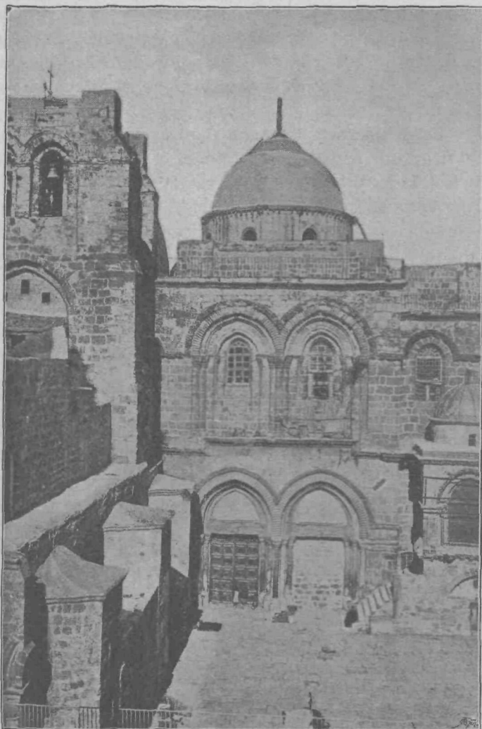
Cerkev božjega groba.

Prevzeti smo bili svetega spoštovanja do svetih krajev; zato nas vsa turška ošabnost ni prav nič motila v naši pobožnosti.