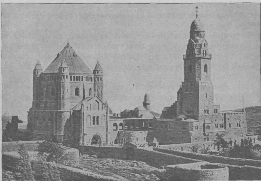
Cerkev Marijine smrti na Sijonu.

Odtod so vodili vojaki v spremstvu pismarjev in farizejev Veliki petek Jezusa skozi vse mesto — skoro pol ure daleč — dol v grad „Antonija“ blizu templja, da ga postavijo pred Poncija Pilata na sodbo.