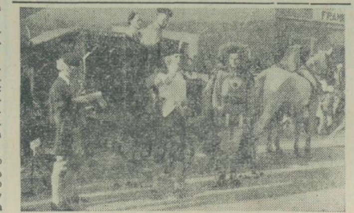
Zeleno carsvo se je pripeljalo