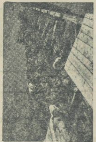
Saj jih niti ne vidimo, kar zrasli so s stolpom...

Rudarji nikakor niso grobi ljudje, kot se to navadno misli, imajo radi svoje delo in vse, ki to delo pravilo vrednotijo. Zivelimo z njimi kot v eni