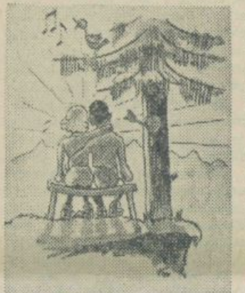
Taki cilji! In praktično delo v tem smislu, pa bi bilo več članov PDU na občnem zboru!

V AO je včlanjenih le 15 študentov-alpinistov. Iz vsega tega je razvidno, da so bili najbolj aktivni prav alpinisti. In ostali člani? Če verjamete ali pa ne, je v PDU vpisanih kar 1033 študentov in je to številčno