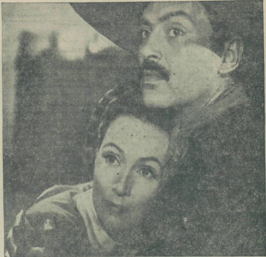
Dolores Del Rio in Pedro Armendariz v filmu »La Marquerida«

Na Ravnah je ljudstvo ob pričetku slovesnosti spontano izobesilo zastave, kar priča o tem, da je imela prireditve globok odmev pri tamkajšnjem prebivalstvu.