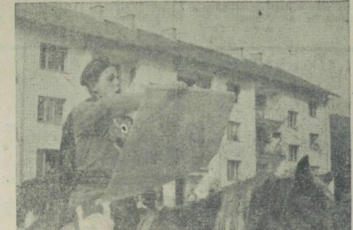
»Brucmajora čita proglaš

Zvočniki so prenašali predavanja na trg in v železarno. Prirejen je bil tudi izlet v Prežihovo Kotlje. V diskusiji je zastopnik študentov,