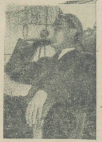
Fotografija iz nemške študentske revije »Colloquium«, kjer pod njo piše: »Kdor nosi čepico in straka mora imeti svoj vrček tudi doma«

sosed in ti nazdravi. Če ne piješ do dna si ga užalil in ta ima pravico zahtevati odškodnino. Kot odškodnino moraš n. pr. popiti »škorenje« piva (tri litre!) naenkrat in sam plačati — to je najnižja kazen, ki se stopnjuje vse do skrivnega dvoboja.