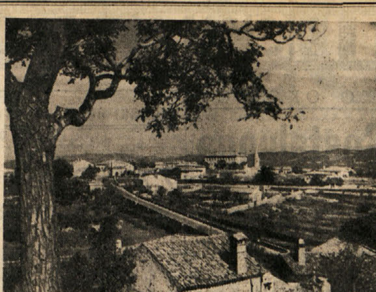
Pogled s Kontovela na Prosek