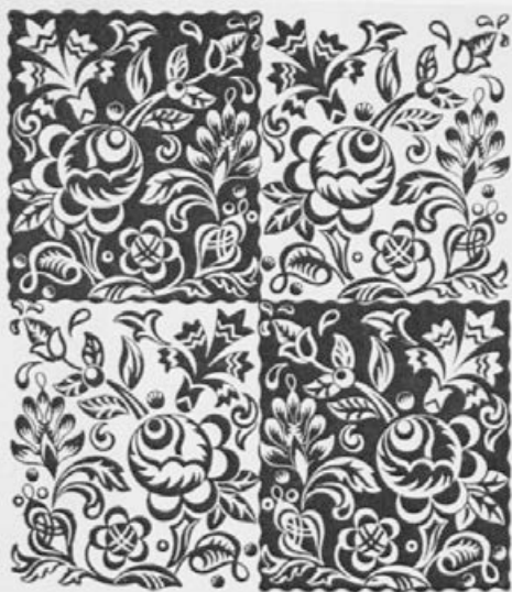
OSNUTEK ZA TISKANE ZAVESE ENA OSMINA NARAVNE VELIKOSTI RISBA BREDE ŽELEZNIKOVE, I. LET.