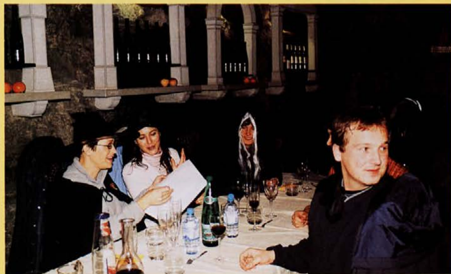
Zmagovalna ekipa, ko še ni vedela, da bo zmagala.

(O poti proti domu pa ne gre izgubljati besed, saj smo jo prespali.) ●