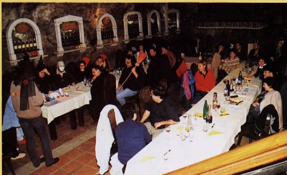
Večerji je sledilo intelektualno naprežanje.

Sledila je vožnja do Sežane, kjer smo pisuni sklenili povečerjati in si privezati duše po številnih razburljivih dogodkih tega dne. Pred večerjo, ki je po obilnosti zagotovo prekašala marsikatero starorimsko požrtijo, smo si ogledali kratek film o pridelovanju vina. Sledila je degustacija nekaterih vin in ob vsaki sorti kratko, zanimivo predavanje. ➤