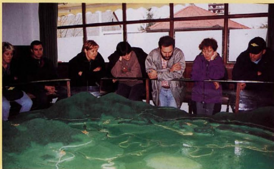
Strmeči pisuni med ogledom žive makete Cerkniškega jezera.

← tudi življenje vaščanov na njegovih bregovih. Stoletja sožitja z neizprosno, muhasto naravo so kovala klene značaje in trdno voljo. - Po filmski predstavitvi jezera smo si v veliki sobi ogledali tako imenovano živo maketo Cerkniškega jezera, spoznali njegovo okolico in s pomočjo posebnega mehanizma opazovali, kako voda zaliva jezersko dno in kako se skozi požiralnike umika v globine tal. Obakrat nas je