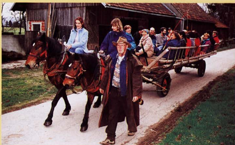
Ob povratku z vratolomne vožnje: uničeni, toda živi!

spremljal gospod Vekoslav Kebe, ki je tudi avtor knjižice o jezeru in okolici in katerega načina pripovedovanja se človek zlepa ne naveliča. Naj še povem, da smo se pred vhodi obeh prostorov soočili s coprnico Uršulo, ki tamkaj noč in dan jezdi na metli in meče v svet strupene poglede. Pouku je sledila malica na prostem. Popestril jo je droben krt, ki se je - ne meneč se za našo glasnost - kar lep čas