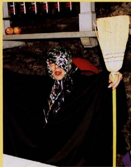
Ali jo spoznate?