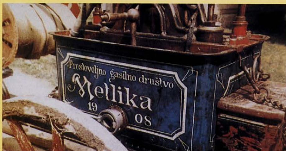
Sprehodili smo se po starodavnem mestecu Metliki in obiskali gasilski muzej. Ste vedeli, da je prvo gasilsko društvo na Slovenskem nastalo prav v Metliki leta 1908?