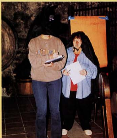
Neizprosni čarovnici v komisiji.

◀ Kot vsako leto, smo se pisuni po večerji predali intelektualnim užitkom. Razdeljeni v štiri skupine (Martinove gosi, Konvertibilni, Uršule & Uršulini in Lojtrnik) smo se pomerili v poznavanju čarovništva. V komisiji so bile kar tri čarovniško nastrojene pisunkice, med njimi čaravnica Kunigunda, ki je ob vsakem napačnem odgovoru škodoželjno in predirljivo zakreketala. Sledila so ugibanja