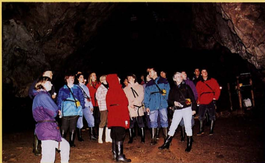
Na začetku poti v mračno, neznano osrčje zemlje.

◀ vrha zvonika lep razgled, vendar smo mu raje verjeli, kot da bi plezali v višave. Mudilo se nam je namreč v nasprotno smer - v zemeljske globine Križne jame.