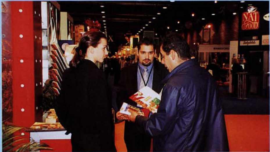
Pri promociji Argete nam je bila v pomoč prikupna hostesa iz Pariza.