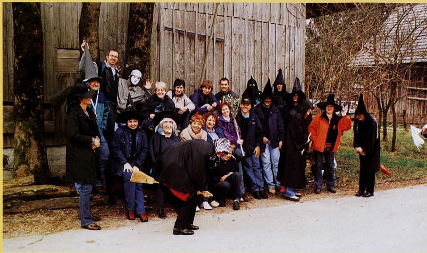
Pisuni so prispeli v deželo čarovnic in Notranjcem razgibali dan.

širni travniki in dolge njive, tihe in lepe v svoji novembrski osamljenosti. Vas ni izgubila čara podeželja, čeprav skozi avtomobili, v katerih bo ljubitelj vaškega življenja raje videl slučajne vsiljivce kot pa nekaj, kar spada semkaj. Svoj prihod v vas smo pisuni, zahotani v čarovniška oblačila, ovekovečili z "eno gasilsko" na hloedih pred gostilno Kebe. Naša prva učna ura pa je veljala kratki filmski predstavi o jezeru v različnih letnih časih, o njegovem skrivnostnem presihanju, o živalih in rastlinah teh krajev. Marsikaj smo izvedeli tudi o ljudeh v približno ducatu okoliških vasi, slišali o njihovih navadah in videli dobro ohranjeno orodje. Ker je jezero samosvoje in nenavadno ("jezeru je, jezera nej..."), je samosvoje ➤