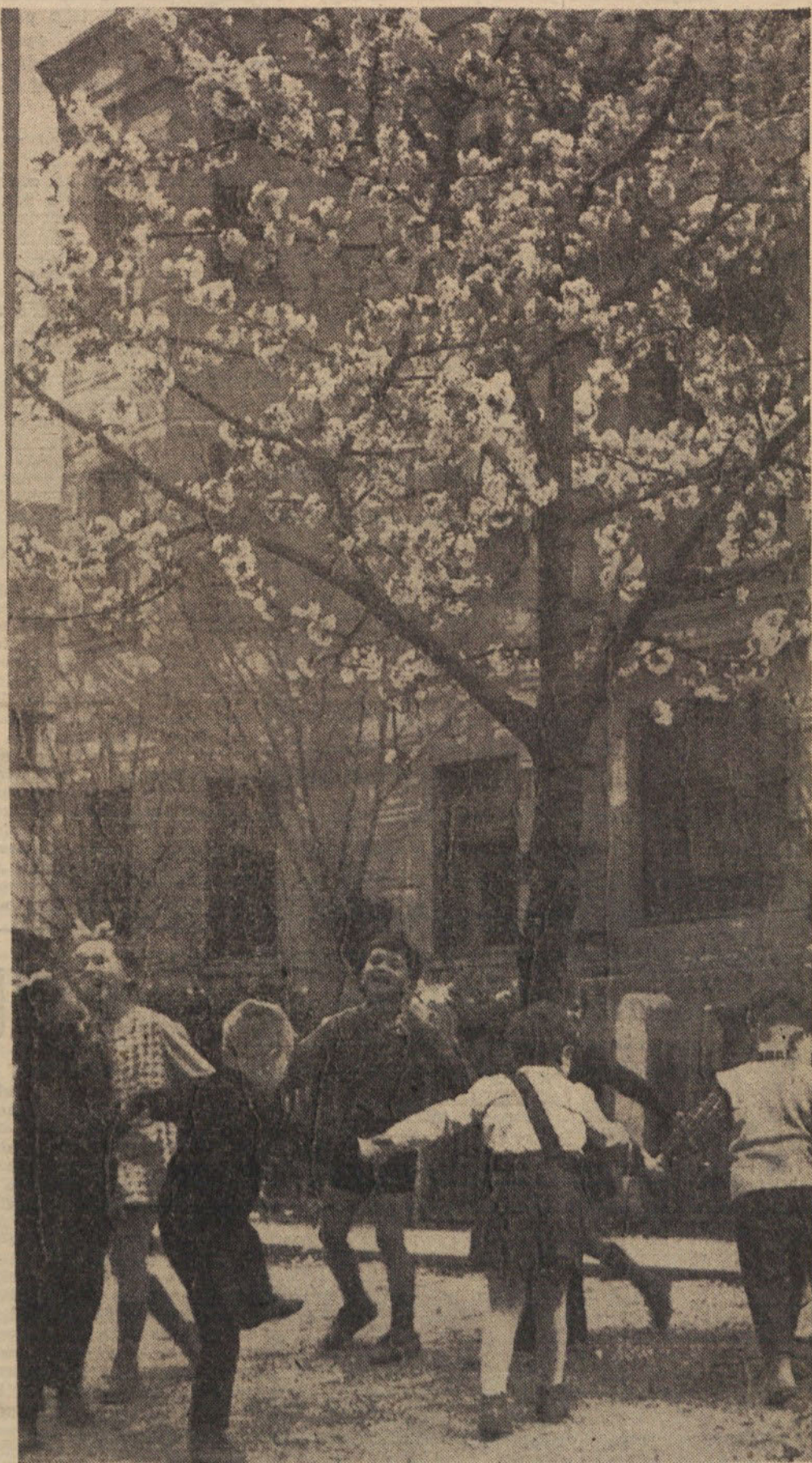
VES MINULI TEDEN SE JE NAŠA MLADINA VESELILA OB SVOJEM PRAZNIKU

V takšnem razpoloženju stiskamo na današnji dan roko našemu jubilarju. Vesel bo te naše čestitke.