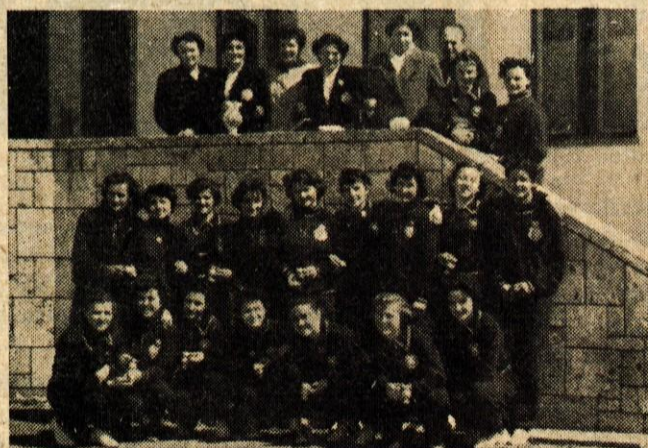
KAMNIK: Mladinke VOJVODINA : SLOVENIJA

Ta zmaga, prva po dveh porazih v spomladanskem delu tekmovalja, bo prav gotovo dalna enajstotric Mladosti novega elana in upajmo, da bo v prihodnjih tekmah zaigrala še bolje.