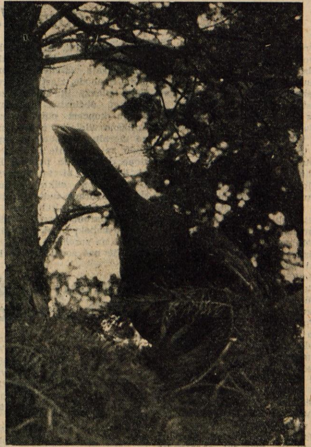
PETELINČEK JE ZAPEL... Začel se je lov na divje peteline

Volitve v Delavski svet Železarne Jesenice