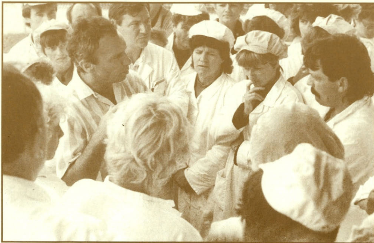
Plaz vprašanj se je vsul po končanem protestnem shodu

Avtor je na domačem trgu poiskal in stestiral substitut za uvožen trafo in s tem pocenil vzdrževanje in prihranil devize.