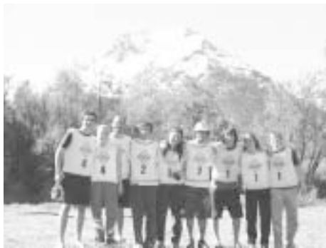
Prvo, drugo in tretje mesto

Prva zahvala gre Bogu, da nam je podaril tako krasne dneve in čudovito pokrajino, ter nas obvaroval nesreč, saj poleg enega rahlo zvitega gležnja ter nekaj prask ni bilo nobene poškodbe med tekmovalcem. Prav lepo se tudi zahvaljujemo Uradu vlade Republike Slovenije za Slovence v zamejstvu in po svetu za delno finančno podporo tega srečanja, brez katere bi bilo za naše društvo neizvedljivo.