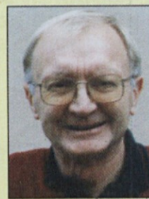
Piše: Doro Hvalica