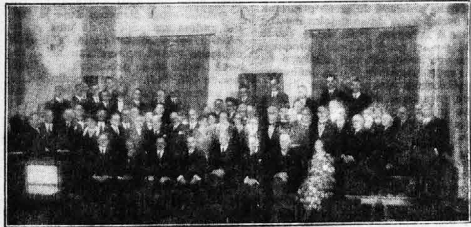
Sednica svečanostnog sletskog odbora ČOS 3. XII. o. g.