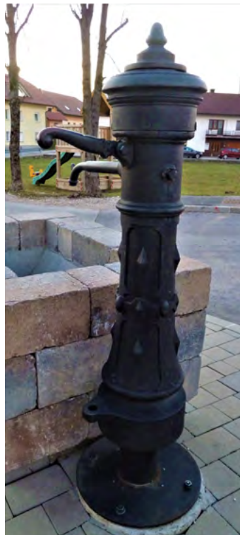
Litoželezni pitnik na Martinj Hribu