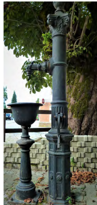
Litoželezni pitnik z zbiralnikom - čašo pred Puppisovo hišo v Gornjem Logatcu