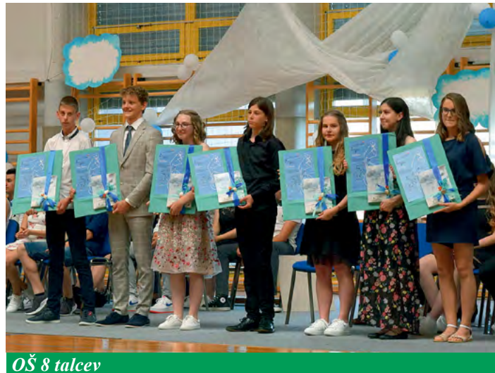
OŠ 8 talcev