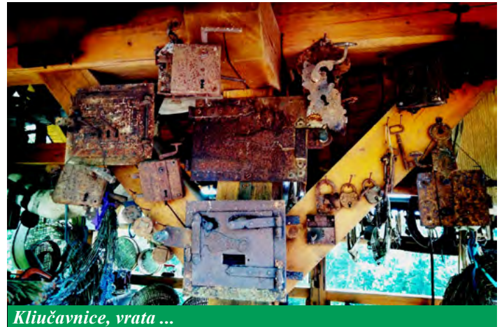
Ključavnice, vrata ...

Opisal sem samo delček vsega, kar je spravljen pod kozolcem. Zbirka se seveda stalno povečuje. Če bi tudi vi radi kaj prispevali za ohranitev narodove kulturne dediščine, ki je našla mesto pod kozolcem Malavašičevih, mimogrede, pripravlja se že prostor v