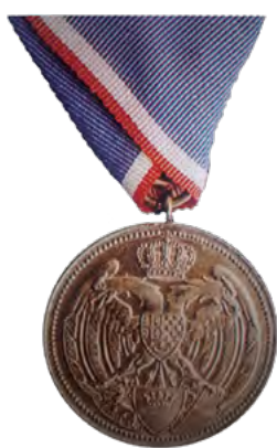
Spomenica na borbe za oslobodjenje severnih krajev Jugoslavije 1918-1919. godine (ustanovljena 10.10.1939)