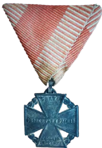
Karlovi bojni križec