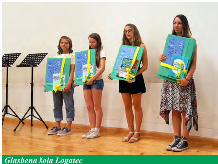
Glasbena šola Logatec

Blanka Markovič Kocen