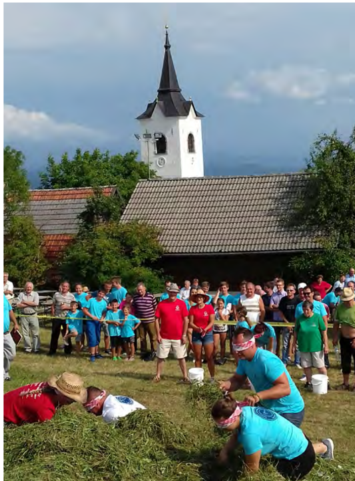
Utrinki s Kmečkega praznika 2017