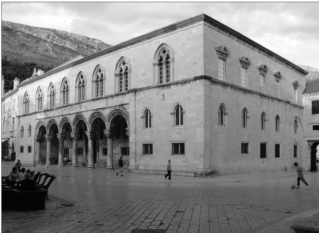
Slika 1: Dubrovnik, Knežev dvor Figure 1: Dubrovnik, Rector's Palace

Pri rekonstrukciji zahodne fasade Kneževega dvora, ki gleda na glavni trg, se lahko naslonimo na Opis Dubrovnik Filipa Diversija, ki je bil zaključen januarja