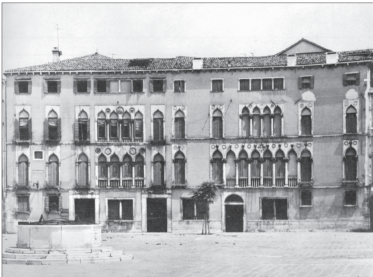
Slika 4: Benetke, Palazzo Soranzo a San Polo, leva polovica 14., desna 15. stoletje Figure 4: Venice, Palazzo Soranzo a San Polo, 14th and 15th centuries

Par saracenskih oken je bil v primerjavi z drugimi okni Kneževega dvora res izjemen. Okni sta od najnižje konzole do vrha križne rože merili kar 31 dlani, torej skoraj osem metrov. Krasila sta jih balkončka z balustradama, krogovičji sta bili zaključeni z veliko križno rožo, okrašeni pa sta bili z vegetabilnim in figuralnim okrasom. Kot kaže pa okni tudi nista bili iz običajnega apnenca s Kamenjaka, saj je v dokumentu zapisano, naj se pri izdelavi oken uporabi kamne, kot so zapisani na risbi (»le piere che vol alle dette fenestre se intenda no secondo stano scritte allo desegno«). Domnevamo lahko, da se je zapis nanašal na kamne različnih barv, kar je primerljivo s saracenskimi okni beneške palače Ca' d'Oro, ki je bila zgrajena med leti 1421 in 1437 (sl. 3; Goy, 1992; Rössler, 2010, 172–183). Okna na Ca' d'Oro so bila poslikana in pozlačena, o čemer pri obeh dubrovniških monoforah nimamo podatkov, vendar pa vemo, da so tudi v Dubrovniku v posebnih primerih zla-