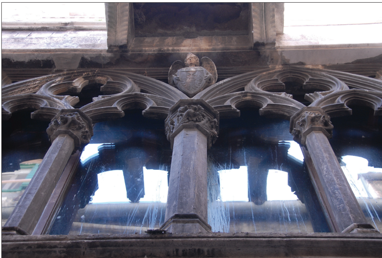
Slika 2: Split, Papalićeva palača, detajl kvadrifore Figure 2: Split, Papalić Palace

1440, kot je zapisano v eksplicitu (Brunelli, 1879–1882, III, 36; Caglioti, 1996, 212: n. 18). V njegovem času je bilo v veliki meri zaključeno pritličje s preddverjem, ki je obsegalo pet stebrov in dva polstebra s kapiteli, od katerih je bil na enem upodobljen Eskulap, na enem pa Salomonova sodba (Brunelli, 1879–1882, I, 41–42). Iz opisa lahko sklepamo, da je bilo preddverje umeščeno podobno kot danes, torej med dva vogalna stolpa. Kapitel z Eskulapom se najverjetneje nahaja na svojem prvotnem mestu, torej na steni jugozahodnega vogalnega stolpa, kapitel s Salomonovo sodbo, ki naj bi se glede na Diversijev opis nahajal pred vhodom v Knežev dvor, pa je danes shranjen v mestnem muzeju.