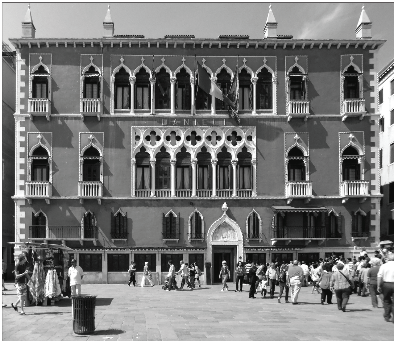
Slika 5: Benetke, Palazzo Dandolo, druga polovica 15. stoletja Figure 5: Venice, Palazzo Dandolo, second half of the 15th century

poznamo le višine posameznih delov: stebri brez kapitelov so bili visoki nekaj več kot tri metre, krogovičja dva metra in križne rože en meter. Skupna višina teh elementov ter kapitelov, baz in velike figure Hektorja bi lahko dosegla tudi osem metrov, vendar pa to, če fasado primerjamo npr. z drugim nadstropjem Ca' d'Oro, niti ni nujno, saj je osrednja polifora lahko bila nižja od stranskih monofor. Podatek, da je bila trifora, ki se je v posameznih elementih morala ujemati s kvadriforo in saracenskima oknom, izdelana za stolp z zvonom, nam pove, da so bila okna nameščena na zahodni fasadi. V literaturi je bil do nedavna kot stolp z zvonom prepoznan jugovzhodni stolp pri vratih Ponte (Beritić, 1955, 28; Grujić, 2003–2004, 156), vendar pa dokument z dne 8. aprila 1442 (Folnesics, 1914, 190–191; Novak Klemenčič, 2006, 243; Grujić, 2008, 39: dok.