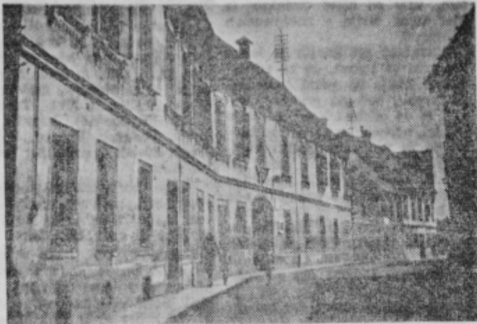
Pročelje »Narodnega doma« v Ptuj je potrebno obnove

Leta 1912 so osnovali v Narodnem domu ptujsko podružnico Dramskega društva v Mariboru, ki