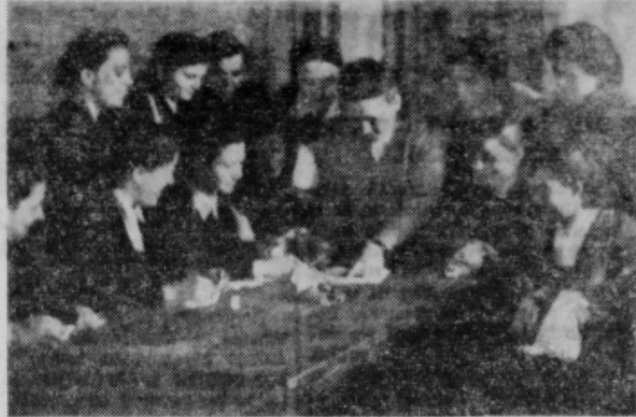
Kmalu bodo zopet začeli tečaji za napredek gospodinjstva

75 let nas loči danes od dneva, ko je postal Narodni dom v Ptuj svetilnik slovenstva vse do propada stare Avstrije, ki je ogrozila naš narodni obstoj. Danes, po izvojevanji svobode, je v njem hram kulturnoprosvetnega društva »Svoboda«, ki je nosilec najnaprednejših stremiljenj sodobnega človeka, člana državne in človečanske skupnosti — s ciljem živeti v enakopravnosti narodov, s prizadevanji najvišjega kulturnega življenja delovnega človeka na zemlji. Da si je lahko društvo »Svoboda« zadalo tako velik program in pomen, je zasluža vseh tistih, ki so nam izvajali svobodo, za katero so se začeli boriti naši čitalničarji v »Narodnem domu«. V. R.