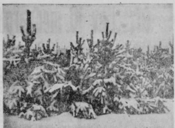
V noči od torka, 3. 12. na sredo, 4. 12. je tukajšnja naravo prekrila 1 cm debela snežna odeja. Padla je na trdno zamrzlo podlago in je bilo v sredo povsod polno sankarjev in smučarjev, ki pa s prvo skromno pošiljko snega niso zadovoljni in upajo, da bo za bližajočo se zimsko počitnice dovolj snega za sankarje in smučarje.

Uresničenje plana razvoja kmetijstva bo terjalo stalna prizadevanja in sodelovanje vseh družbenih in gospodarskih organov in organizacij. Ta plan obsega mnogo najrazličnejših prvin, od izobraževanja kadrov do organiziranja setve ali odkupa, ki se tičejo ne samo posameznih proizvajalcev ali zadrug ali velikih gospodarstev, temveč tudi poslovnih zvez, kmetijskih in trgovinskih zbornic, ljudskih odborov in njihovih organov ter mnogih drugih čimteljev. Njihova dolžnost je, da si poiščejo svoje mesto v tem širokem programu, da v skladu z njim izdelajo lastne programe ter zaposlijo vse sile: vse neizkoriščene rezerve pri tem splošnodružbenem delu, ki je izrednega pomena.