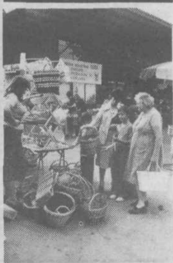
Nova tržnica v Mostah počasi napreduje. Da, počasi, kajti občani si želijo, da bi bila čimprej zgrajena, saj takšne ponudba kar na tleh že dolgo ne ustreza sodobni ponudbi blaga. HVAŠTJA