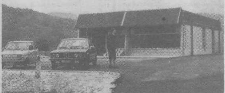
V Senožetih je trgovina Mercator-tozd Golovec že pod streho. Vaščani upajo, da bodo kmalu lahko tudi kupovali v njej. AM