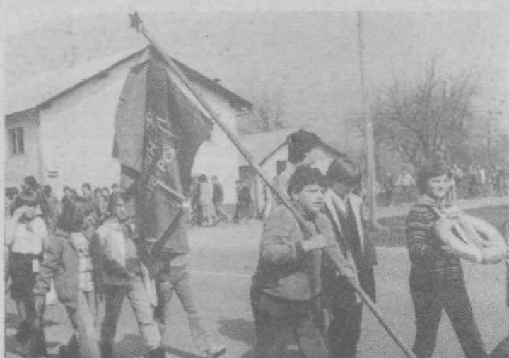
Tudi najmlajši so se pridružili deset — in desetisočem na pohodih Po poteh partizanske ljubljane. Na sliki so pionirji OŠ Karla Destovnika-Kajuha na pohodu proti Fužinam

Ce pogledamo analizo uresničevanja politike zaposlovanja v naši občini za prvih devet mesecev leta 1981, vidimo, da pogodbeno delo v primerjavi z letom 1980 upada. To pa še ne pomeni, da ga ni veliko, saj je bilo v lanskim omenjenih mesecih opravljenih 100.368 ur dela po pogodbah. Če pa primerjamo se obseg opravljenih nador, vidimo, da se je leta povečal in jih je bilo v prvih devetih mesecih lanskega leta oprav-