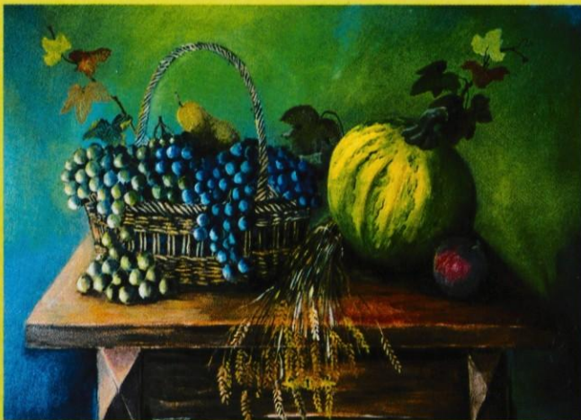
Tone Drab - Tihožitje