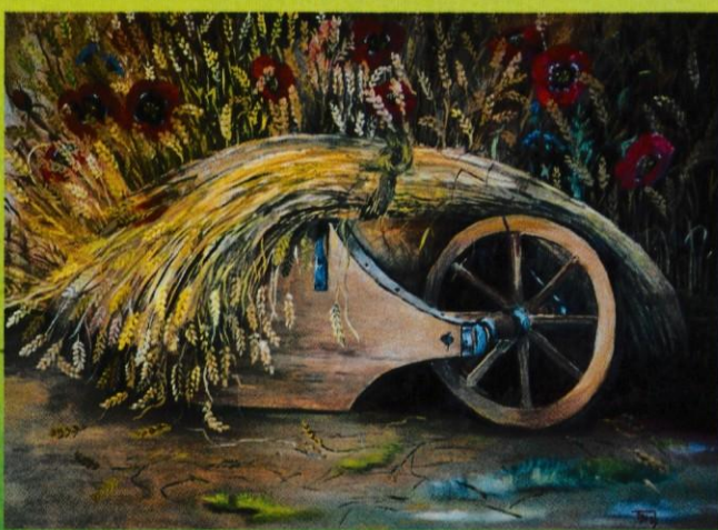
Tone Drab - Klasje