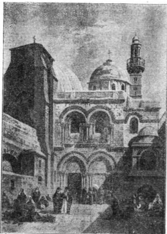
Cerkev božjega groba v Jeruzalemu.

Po vsakem svetem obhajilu postaja naše srce kraj, kamor položijo Telo našega Gospoda Jezusa Kristusa. Če koga sprejmemo, ga pač ne bodemo z gnusobo in neredom žalili, zasramovali! — Nov grob, prenovljeno srce ponudimo torej Jezusu, kakor je to storil Jožef Arimatejec. Nikdar ne smemo tedaj sprejeti sve-