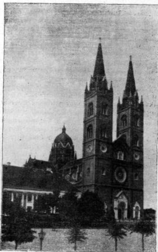
Cerkev v Djakovem — odspređaj.