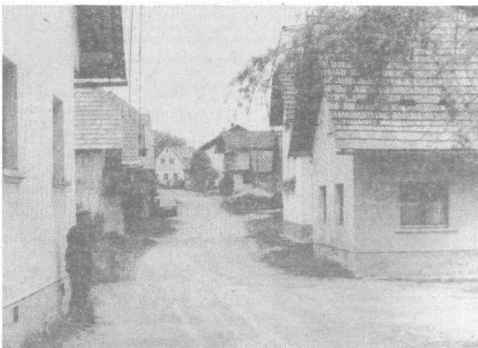
Dvorska panorama: staro se kar ne more umakniti novemu

Farni zapiski in starjši krajanji vedo povedati, da je v Dvorski vasi že pred vojno šlo marsikaj narobe. Dvor-