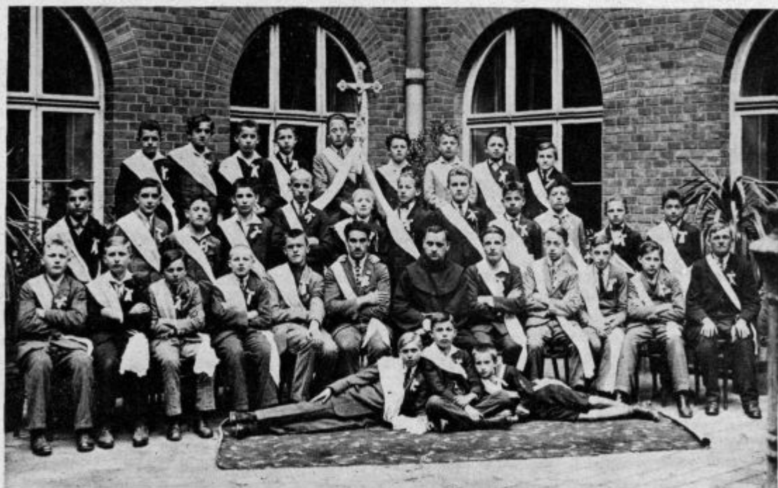
Mladiška Marijnska družba pri Materi milosti v Mariboru.

imelo.« V njegovi družini je bila leto in dan, zjutraj in zvečer, vedno brez izjeme skupna družinska molitev. Kljub temu, da je bil pol ure oddaljen od župnijske cerkve, je bil vendarle vsak dan pri sv. maši, a vsako nedeljo pri sv. obhajilu. »Blagoslov, ki ga pri sv. maši zadobim« — je dejal — »je velik; ne samo, da nič ne zamudim, ampak veliko pridobim, in ves dan mi gre