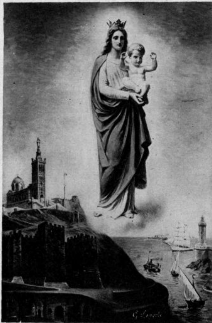
Marijina božja pot; N. D. de la Garde v Marseju.

Ali si se že kdaj v življenju izgubil na poljani bujnega divjega rastlinstva? To je bilo kak večer, ko jesensko enakonočje skazi vreme in vetrovi neprestano skačejo iz obzorja na obzorje. Od vseh strani prihaja vihar in piha od desne, od leve, od spodaj, od zgoraj; odvezali so se vsi severni in vsi južni vetrovi. Mrzle in vroče sape te naskočijo, te tepó, te mrazé skoraj obenem. Ne veš, katerega teh pobesnelih vetrov čuješ; zbejš se, postojiš in pričakuješ trenutka miru, ki pa sploh ne pride.