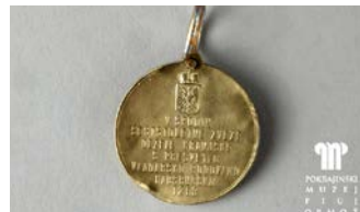
MEDALJE, MALE UMETNINE V LUČI HABSBURŠKE MONARHIJE 21. 9., 18.00 Ptujski grad