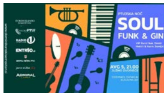
SOUL FUNK & GIN - VIP BAND 5. 8., 20.30 Dominikanski samostan