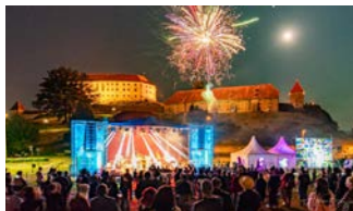
UP! FEST URBANA PANORAMA FEST 12. 8., 17.00 Panorama Ptuj