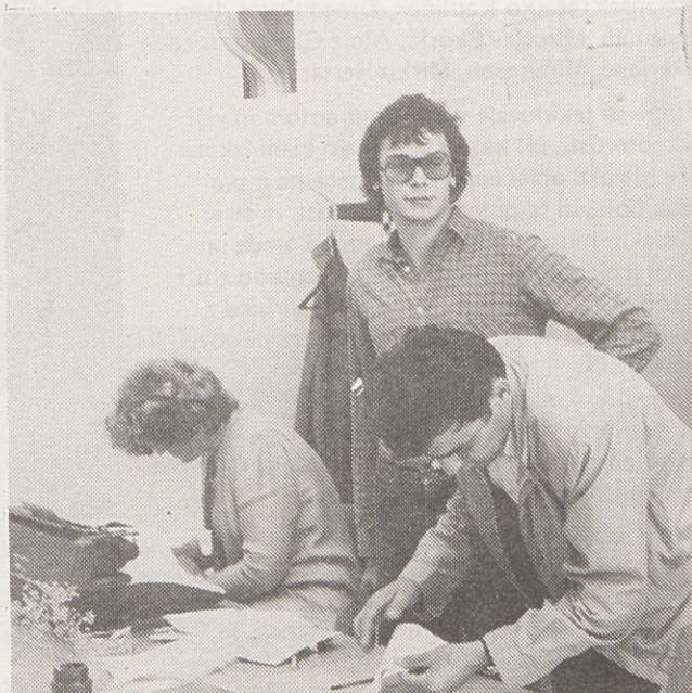
Pomembni so tudi dokumenti . . .

Vzdušje pri delu je resnično tovariško. Mnogi so spoznali delo v skladišču, se spoznali tudi med seboj in te pobude iz prodaje so lahko za vzor še marsikje. Dosedanje izkušnje so že pokazale tudi marsikatero prednost takšnega dela, ki bi ga lahko uvedli še drugod.