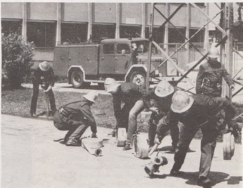
Člani obeh ekip Gorenja so trenirali kar v tovarni, kjer so imeli pri roki vse potrebne rekvizite.

Služba za rekreativno in kulturno dejavnost nam je poslala sporočilo, da bodo šotore izdajali vsak torek in petek od 8. do 12. ure v tozdu Galvana.