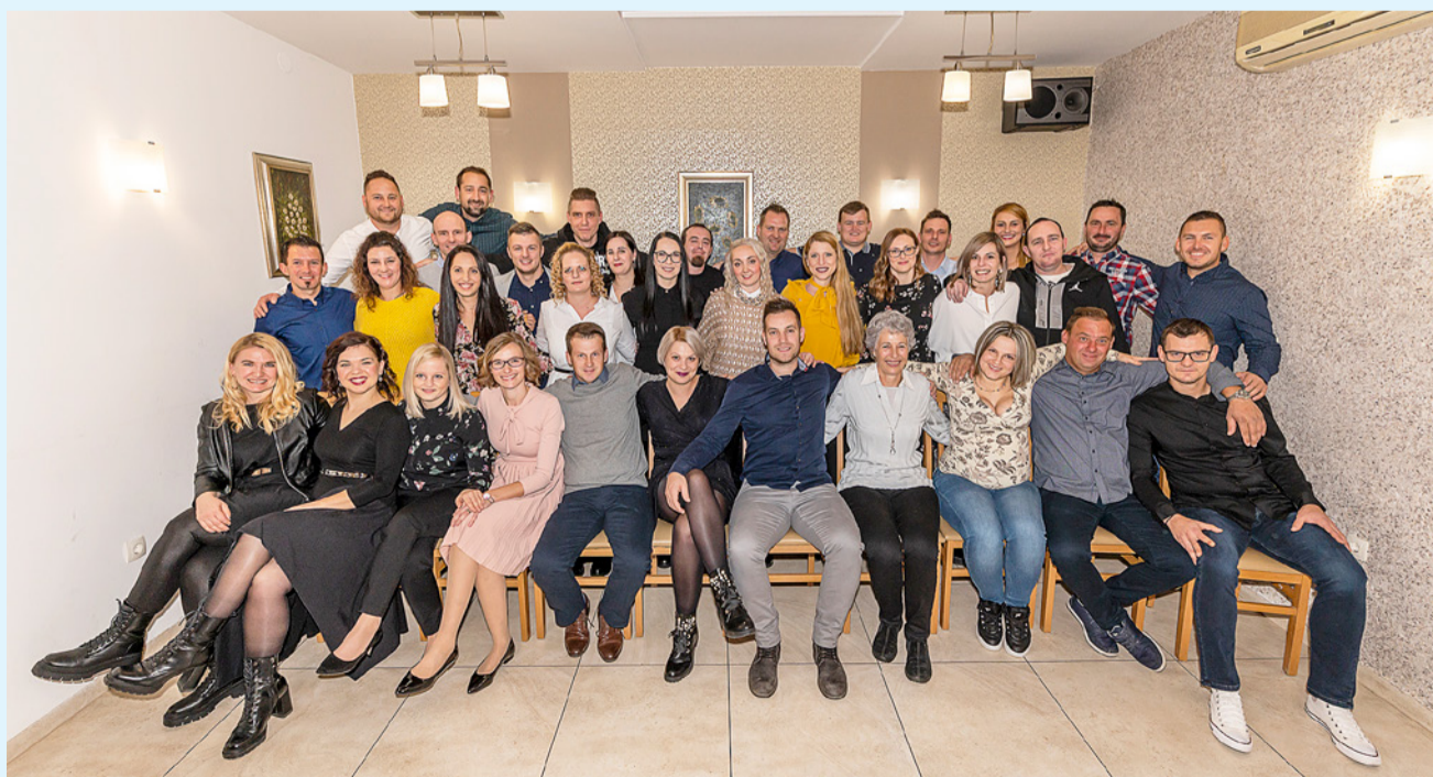
Zbrani sošolci na srečanju