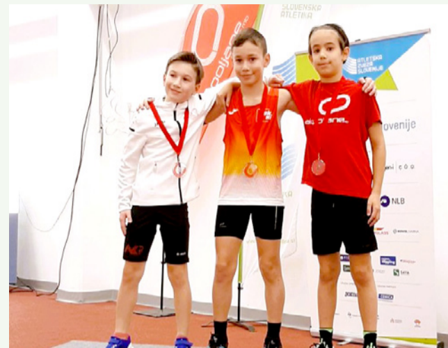
Foto: arhiv Jurij Ferčič (prvi z leve), 2. mesto, Maribor Indoor Meeting, 3. februar 2024