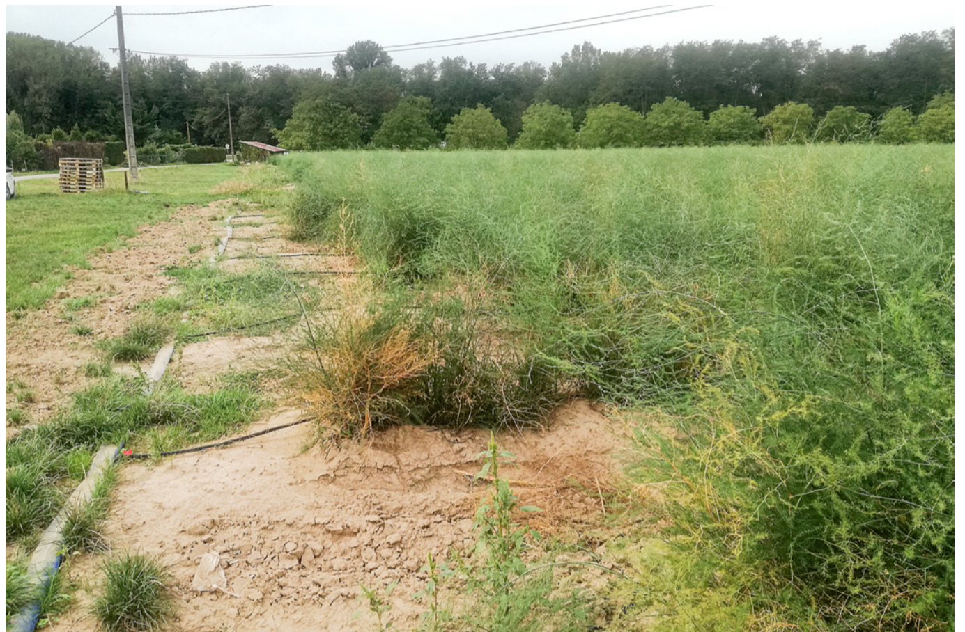
Kapljično namakanje špargljev

Reka Drava s svojim snežno-dežnim režimom tudi v sušnih razmerah premore dovolj vode za namakanje, zato je v občini Markovci predvidena izgradnja večjega namakalnega sistema na površini 310 ha, ki bo pome-