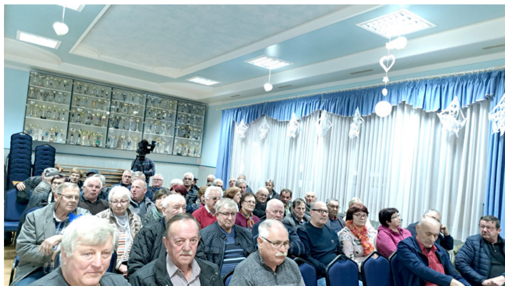
Številčni obisk gasilskih veteranov