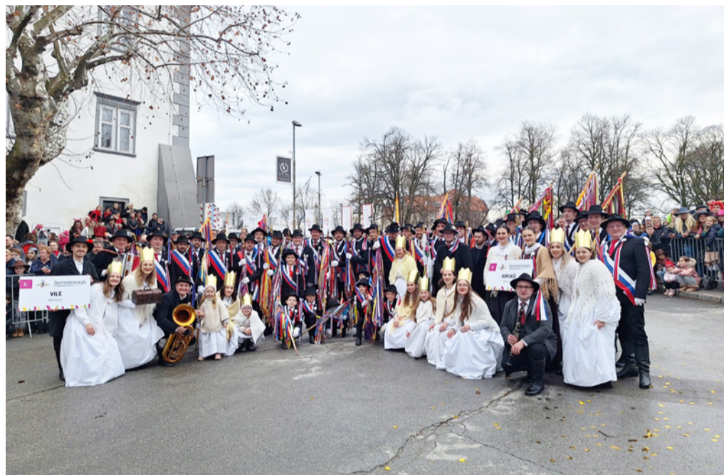
Karneval na Ptuj

Folklorniki so zaplesali tudi na poroki svoje bivše plesalke