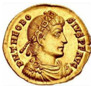
Flavius Theodosius Augustus oz. Teodozij I., 67. cesar Rimskega cesarstva

Na Ptujskem polju cesarja Teodozija 1. in njegove armade ni pričakala nasprotnikova vojska in cesar je lahko mirno razporedil svoje enote ter se pripravil na boj z ostanki Maksimove vojske, ki jo je tokrat vodil njegov brat Marcelin. V zgodnjem avgustu leta 388 je prišlo do dvodnevne krvave bitke. Prvi dan bitke ni prinesel odločitve, naslednji dan pa je del Marcelinove vojske prestopil na nasprotnikovo stran in bitka je bila odločena ter se končala z zmago cesarja Teodozija 1. S