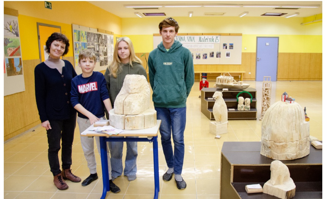
Udeleženci kiparskega srečanja s svojo mentorico

Na otroški kiparski koloniji v Malečniku sodelujemo že od leta 1996. Na vsaki delavnici so bili učenci deležni novih ustvarjalnih izzivov, spremembe