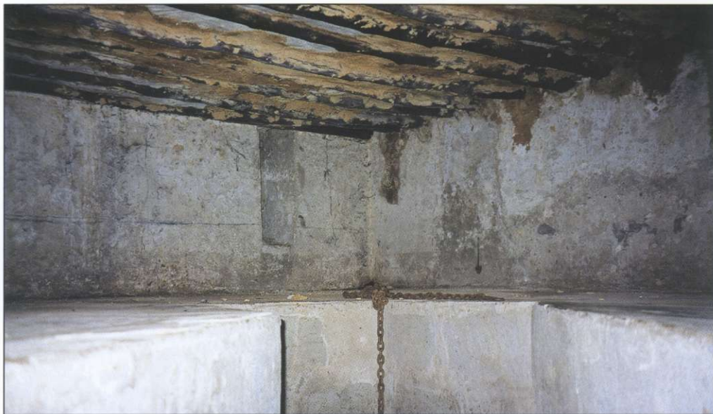
Slika 2: Bogastvo Kamnitega mesta se je dvignilo iz krvi in znoja sužnjev. V nekaj kvadratnih metrov veliki ječi s širokim kanalom za iztrebke se je stiskalo več kot 50 zajetih Afričanov. Surovo ravnanje na poti in nevzdržne bivanjske razmere so preživel le najmočnejši.