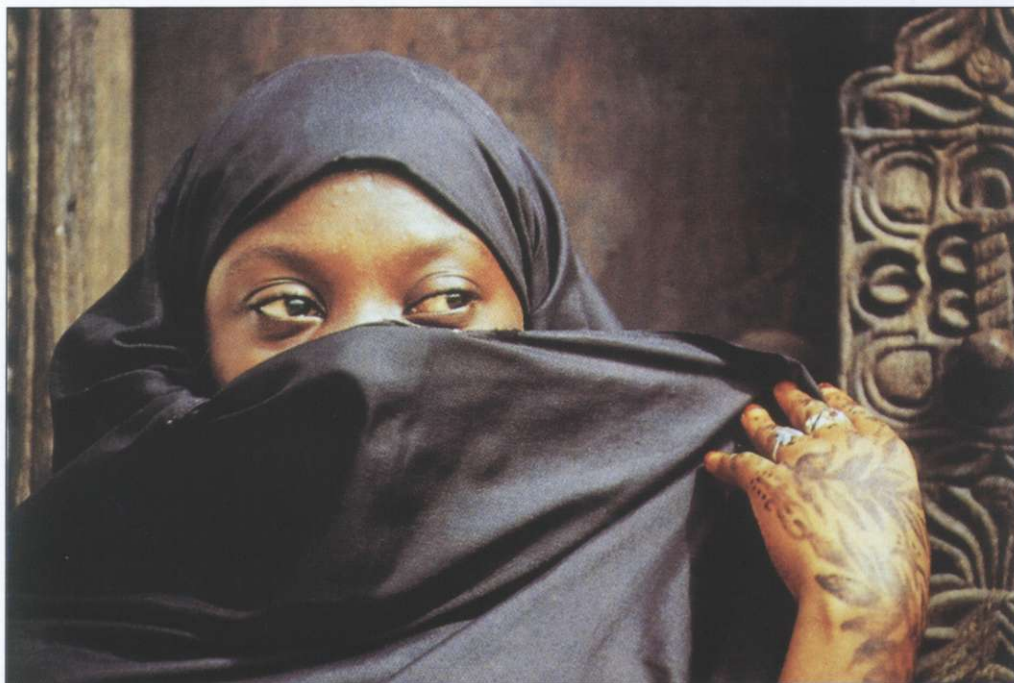
Slika 3: Poldrugo uro dolga vožnja s katamaranom iz Dar es Salaama te prestavi v nov svet: arabski svet ozkih uličic, notranjih vrtov in številnih trgovin, v svet korana in zastrtih žensk.