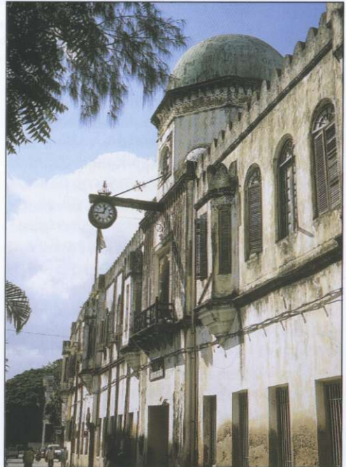
Slika 5: Kolonialna preteklost Zanzibarja je pustila pečat v arhitekturni podobi.

Pod arabskim vplivom se je izoblikoval jezik svahili oziroma kisvahili, v osnovi bantujski jezik, ki je v stoletjih stikov prevzel mnoge arabske besede in arabsko abecedo, v kasnejših stoletjih tudi posamezne portugalske in angleške besede. Tudi samo ime izhaja iz arabske besede sawahili , kar je množinska oblika pridevnika 'obalen'. Vse do 19. stoletja je bil omejen na arabska trgovska mesta na obali vzhodne Afrike, takrat pa se je po trgovskih poteh razširil v notranjost afriške celine. Kolonialna oblast ga je uvedla v upravo in gospodarstvo, misionarji pa so v njem napisali knjige, ki so služile verskim potrebam in arabski zapis spremenili v latinični. Za osnovo so vzeli zanzibarsko narečje kiUnguja, ker je bil ta otok takrat