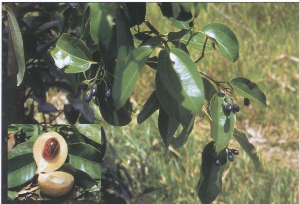
Slika 6: Tropsko drevo muškat rodi sadeže v velikosti večje olive, ki so najprej zlatorumene barve, kasneje pa potemnije. Iz njihovega notranjega dela pridobivajo mušklatni orešček, iz tanke rdeče prevleke, ki ga obdaja, pa mušklatni cvet (foto: Mimi Urbanc).

kulturno in gospodarsko središče vzhodne Afrike, in s tem postavili temelje standardnega jezika. Danes je to lingua franka v večjem delu vzhodne Afrike: Tanzaniji, Keniji, Zairu in Ugandi. Vpliv arabske kulture nam razjasni tudi naslednji primer. Svahilijska beseda ustaarabu , ki izvira iz arabščine, ne pomeni samo 'postati Arabec', ampak tudi 'civilizacija'. Postati Arabec oziroma sprejeti muslimansko vero je pomenilo civilizirati se. Tako je Zanzibar civilizirana mešanica: v preteklosti Afričanov in Arabcev, danes pa tradicije in sodobnosti.