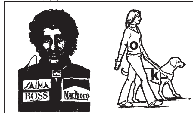
Avtor: Edi Klasinc

Rešitev rebusa iz prejšnje številke: VERTIKALA