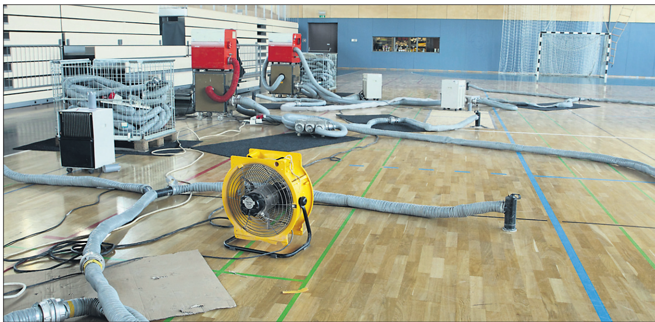
Napaka v gradnji bo krita iz garancije, do takrat pa telovadbe v šolski telovadnici šolarji ne morejo imeti.

Od takrat, ko je telovadnico zalila voda, šolarji v njej športne vzgoje ne morejo imeti, zato se pač znajdejo drugače. Ob slabem vremenu jo izvajajo v športnem kabinetu in v prireditvenem prostoru, učenci od 1. do 5. razreda pa v učilnicah. Lažje bo sicer ob lepem in suhem vremenu, ko bodo športno vzgojo prestavili na zunanje