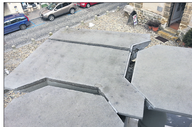
Objekt MG Ptuj je od petka, 1. marca, ogradjen, saj je na ograji balkona zgradbe prišlo do razmikanja elementov ...