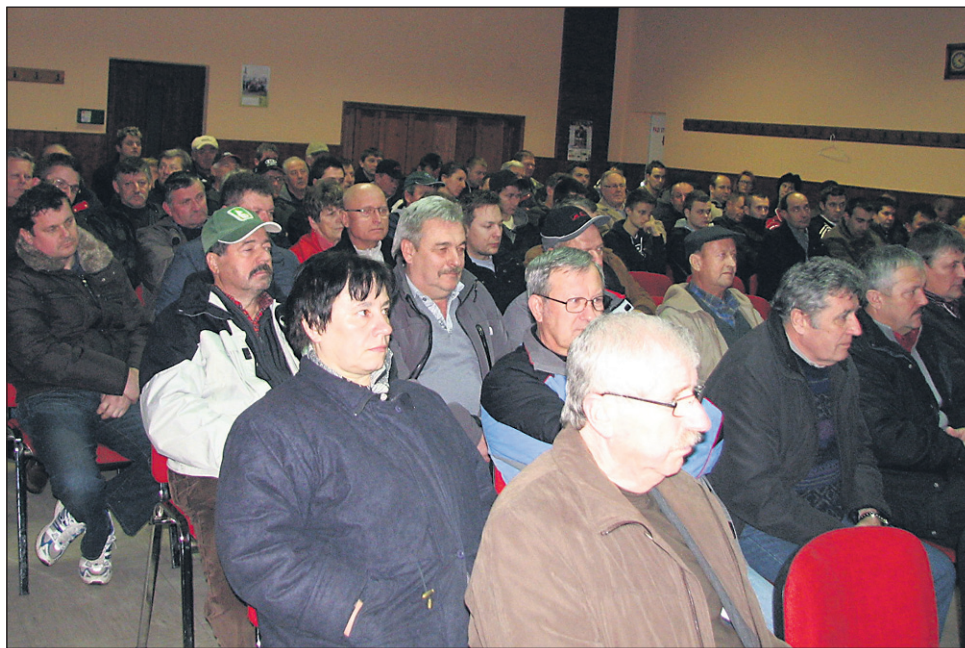
Dvorana v pobreškem domu je bila polna ljudi in njihove jeze nad traso daljnovoda, ki ga nikakor ne sprejemajo, zato so podprli oziroma izglasovali sklepe CI, da so proti daljnovodu nasploh, da naj se uredba izniči in DPN ovrže ter da naj CI nadaljuje postopke proti umeščanju daljnovoda.

Zbor krajanov so tokrat končali z glasovanjem, v katerem so vsi prisotni izglasovali, da naj se DPN za daljnovod ovrže, uredba izniči, da daljnovoda enostavno sploh nočejo ter še, da naj CI in kasneje društvo nadaljuje postopke proti umestitvi daljnovoda, kot si jih je začrtalo.