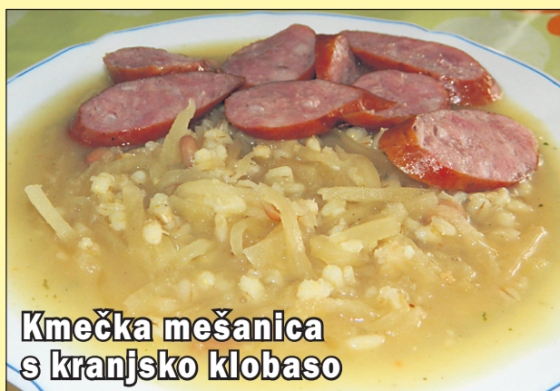
Kmečka mešanica s kranjsko klobaso