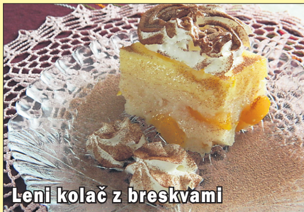
Leni kolač z breskvami