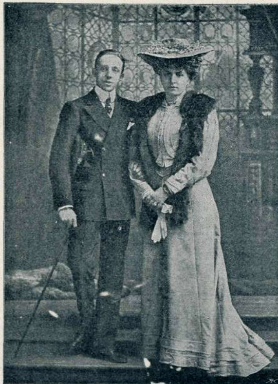
ŠPANSKI KRALJ ALFONZ XIII. Z NEVESTO ENO BATTENBERŠKO.