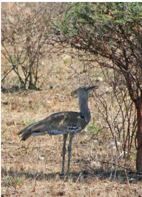
ORJAŠKA DROPLJA ( Ardeotis kori )