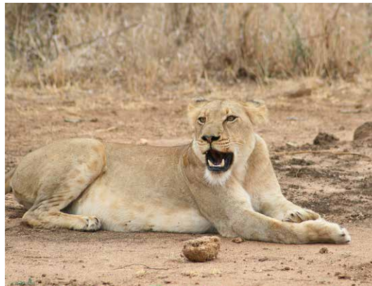
AFRIŠKA LEVINJA ( Panthera leo )

( Gyps bengalensis ) ter golouhi ( Torgos tracheliotus ) in kapucasti jastrebi ( Necrosyrtes monachus ), ki oprezajo za morebitnimi ostanki plena velikih plenilcev.