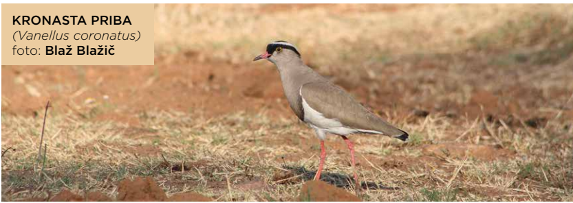
KRONASTA PRIBA ( Vanellus coronatus )