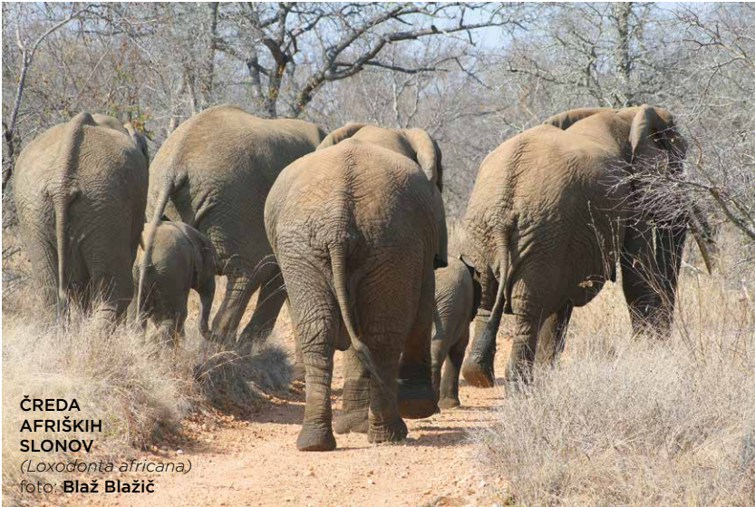
ČREDA AFRIŠKIH SLONOV ( Loxodonta africana )