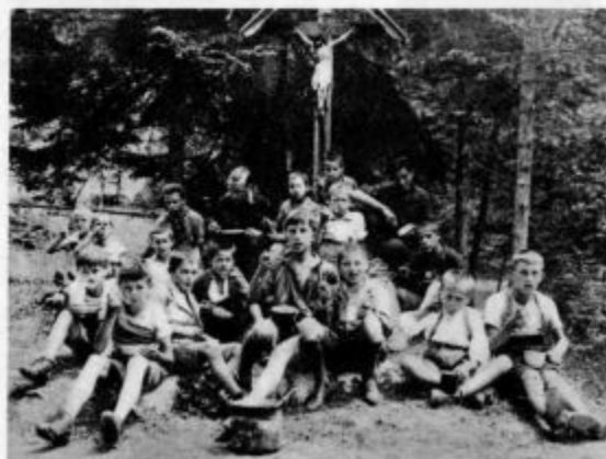
Pri kosilu počitniške kolonije

Taki in podobni glasovi so se oglašali in razburjali celo družbo in čula se je celo grožnja, da hočejo raje zapustiti Marijino zastavo kakor pa odjenjati. Po pravici in po resnici povedano: v teh glasovih nisem mogel najti nobenega hrepenenja po svetosti in po popolnosti, sploh nobenega hrepenenja po dobrem in blagem, pač pa sem v duhu gledal, kako dviga tisti ne-