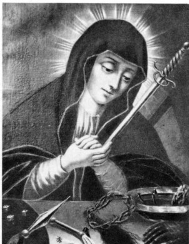
Marija sedem žalosti