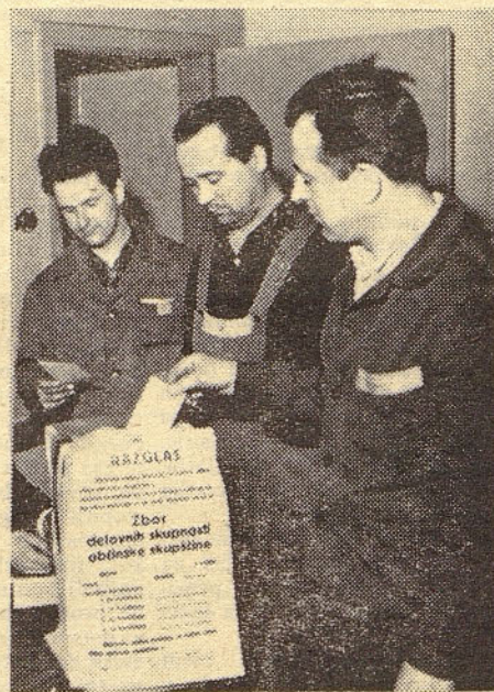
Z nedavnih volitev v produkciji kranjske tovarne