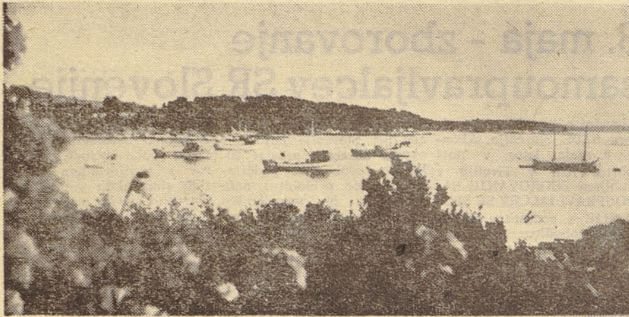
Pogled iz našega doma v Poreču na prijetni zaliv