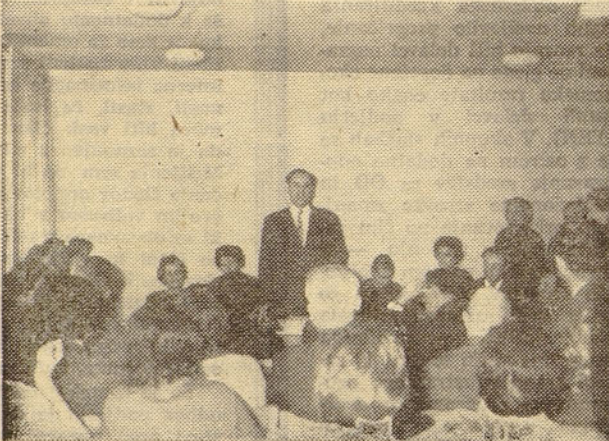
Posnetek s predvolilnega zbora delovnih ljudi DE skupnih služb v Ljubljani

Kolektiv v Horjulu je imel zborovanje 2. aprila ob 12. uri. Razprava je bila dokaj razgibana, saj je zbor trajal do pol treh popoldan. V razpravi so člani kolektiva stavili vprašanje o realnosti plana za leto 1965, vzrokih za slabo realizacijo in restrikciji deviz. Navzočih je bilo 98 % članov kolektiva.