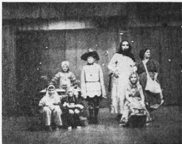
Tile so nam pripravili igrico na letošnji Materinski proslavi

Naj bi bil ta koncert, kakor so bili vsi doslej, lep uspeh naše mladine. Ravno starši pri tem lahko veliko pripomorejo, saj mladina zavisi od njih. Od njih dobre volje in njih razumevanja, od njih vzpodbujanja in njih pametne presoje. Eni kot drugi naj bi z vsem srcem sprejeli izrek: Ni važna zmaga — važno je sodelovanje! Zmaga pač samo eden, sodelovanje pa nas vse duhovno bogati in plemeniti. To zadnje naj bi nam v obilni meri nudili ti koncerti.