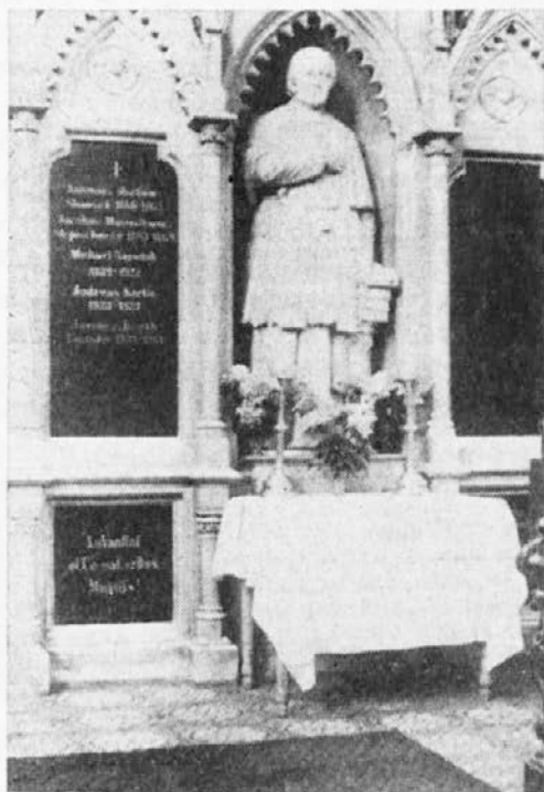
Spomenik škofa Slomška v mariborski stolnici

Škof Slomšek je z velikopoteznim korakom prenosa škofijskega sedeža in ureditve meja štajerski del slovenskega naroda rešil tujega vpliva. Da je bilo tudi njegovo kulturno delo zlasti z ustanovitvijo naše najstarejše knjižne založbe, Mohorjeve družbe, ogromnega pomena za ves slovenski narod, menda ni treba posebej poudariti. Nam vsem je svetel zgled v svoji narodni zavednosti in ljubezni do materinega jezika, kakot tudi v krščanski gorečnosti in ljubezni do Boga, saj si je s svojim svetniškim življenjem zaslužil ime božjega služabnika in oltarnega kandidata. Proces za njegovo proglasitev med blažene in nato med svetnike je v teku.