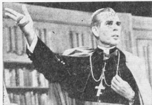
Škof Sheen — ki je več let nosil naslov "Mr. Television", ker je s svojim sporedom pritegnil največ poslušalcev