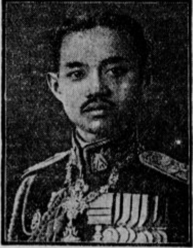
Siamski kralj Prajadipok, ki je star 39 let in kate- rega so revolucionarji zaprli kot talca na neki bojni ladji.