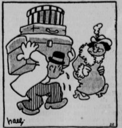
»Smešno, da se zaradi te peščice prtjljage tako potiči. Saj mi jemlješ vse veselje za potovanja.«

»Tudi jaz poznam sugestijo. Imel sem bolnika, ki bi brezpogojno moral za nekaj časa na toplo podnebje, na sonce. Toda ni imel denarja, da bi si privoščil rivijero. Tedaj sem na strop njegove sobe narisal sonce in mu sugeriral, da je to pravo sonce.« »In je pomagal?« Zdravnik je žalostno odvrnil: »Revež je unrl vsled solnčarice.«