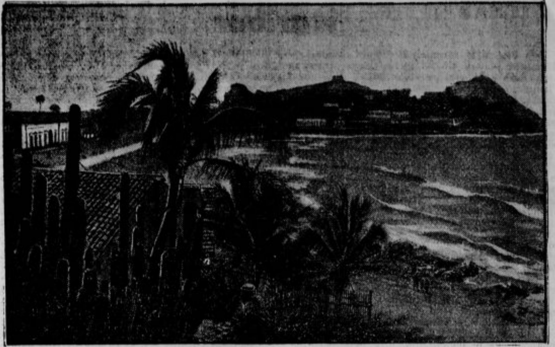
Morje je udarilo čez obrežje v meksikanskem mestu Macatlanu, pri čemer je utonilo nad 500 kopalcev. Morski valovi so vdrli skoraj kilometer globoko v deželo in pri tem porušili vse mesto.

slepčeva pot nekaj tako težkega in naporega, da lahko razumemo, da mu je uspelo to radi tega, ker ga je vodila ljubezen do matere. Kljub temu pa ostane to srečno končano popotovanje za naš, ki imamo zdrave oči nekaj nerazumljivega, če pomislimo, da je na tej 114 km dolgi poti moral iti slepec ves čas po zelo prometni avtomobilski cesti skozi 4 velika mesta ter mnogo vasi. Srečno je prehodil lepo število nevarnih križišč in vedno je s svojim izrednim čutom in sluhom kljub svoji slepoti ušel vsaki nevarnosti in nezdigi. Največje čudo pa je doživel potem policist, ki ga je vodil po cesti sam. Slepec je namreč neprestano opozarjal stražnika na razne okolnosti, ki jih je kljub slepoti zaznaval in mimo katerih je stražnik šel ne da bi jih opazil. Stražnik je dejal, da se mu je skoro zdelo, da ni slepec slep, ampak da ima 4 oči. Tako sta drug drugega srečno privedla do stanovanja slepčeve matere, kjer je stražnik videl tako medsebojno ljubezen, da se je sam zjokal. Mati pa je bila lahko ponosna na svojega nesrečnega fanta, ki je napravil tako čudovito pot slep, le iz ljubezni do nje.