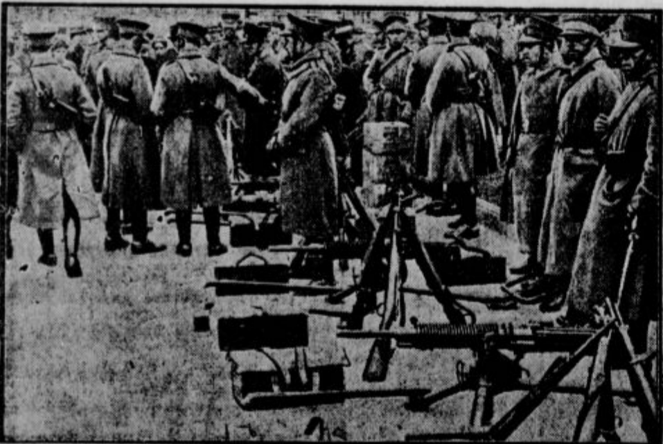
Pogled na ulico v Santiagu, glavnem mestu Čile, prvi dan, ko je izbruhnila revolucija. Kakor vse kaže, je šlo precej zares.