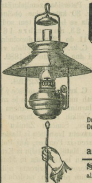
Wiener Blitzlampe 30"

Berlin, München, Mailand, Rom, Lyon, Warschau, Bombay.