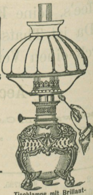
Tischlampe mit Brillant-Meteorbrenner.

für Petroleumlampen in reichster Auswahl.