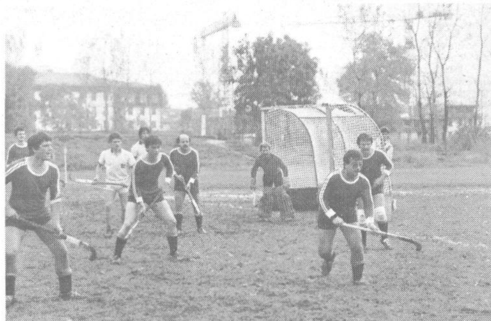
Običajno gledamo hokejiste na ledu - toda tekme na travi so prav tako zanimive.