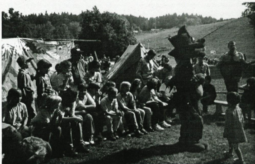
Ena izmed delavnic je bilo tudi druženje s taborniki in petje taborniških pesmi.

Otroci so težko pričakovali sredo, 23. septembra, dan izleta v Velenje. Veliko doživetje je bilo za učence, da smo šli s posebnim vlakom. Po dolgem, dolgem času je na odseku železniške proge Predstruge - Grosuplje in obratno zopet vozil zaradi nas potniški vlak. Pravo doživetje za otroke je bilo, da