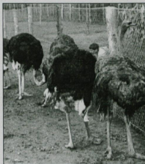
Noji v Sodevcih

Ob sončnem zahodu smo dospeli na Poč v zidanico nad Semičem (zidanicam tu pravijo vinice – izhaja iz besede vino).