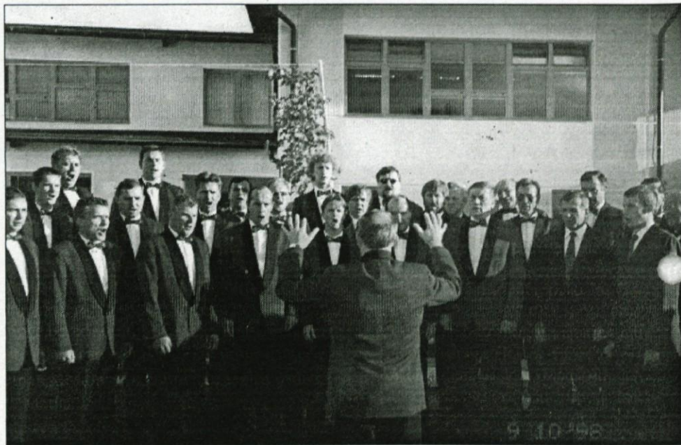
Moški pevski zbor Rafko Fabiani