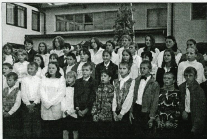
Šolski pevski zbor