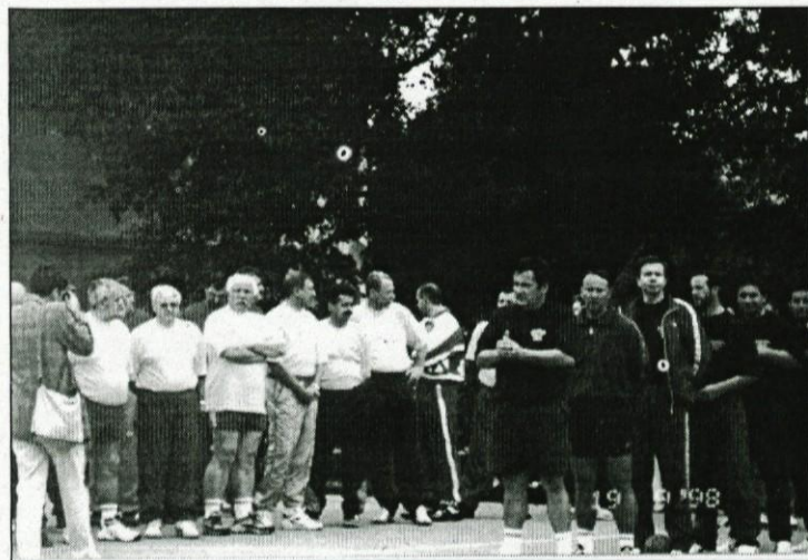
Rokometiši pred tekmo