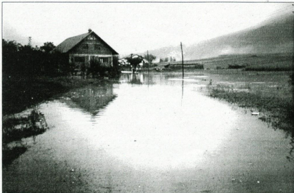
Poplavljená cesta v Kompoljah

Spričo obilnih in daljših padavin je bila vas Kompolje v torek, 06.10.1998, ogrožena zaradi poplavnih voda. Padavinskih voda, pritečejo s pobočja hriba nad vasjo in se stekajo v Rupo v vasi, ta v prvem momentu ni "požrla", kmalu pa se je voda začela