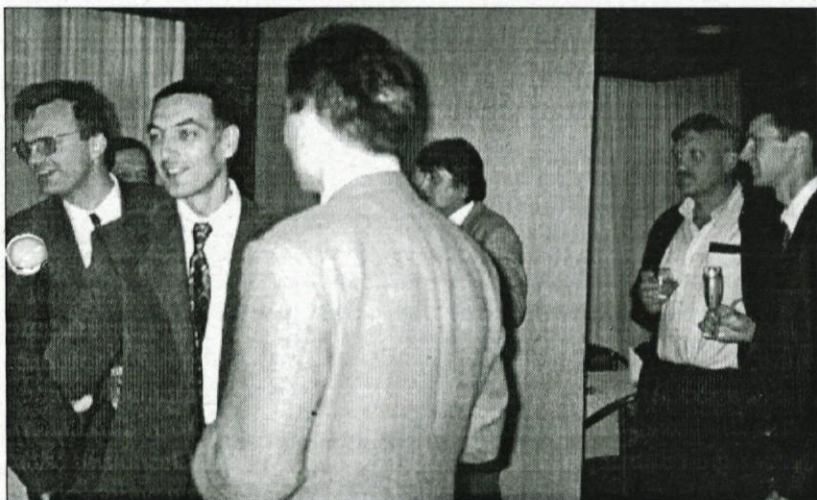
Slika levo: Predstavniki občin v prijateljskem pogovoru po podpisu sporazuma