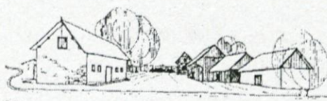
situacija in pogled domačije

- v naselju je več kmetij, kar vpliva na pravilno uporabo kmetijskega zemljišča in ostalih površin v naselju;