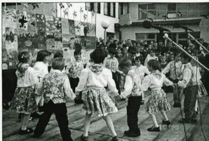
Nastop malčkov iz vrtca