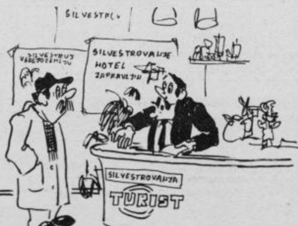
— Poceni lahko silvestrujete tudi od 500 do 1.500 dinarjev! — Kakšna pa je razlika? — V bistvu je razlika samo v ceni.