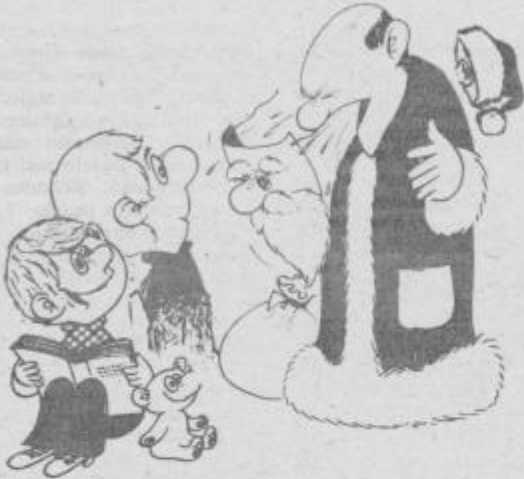
Drugič pa ne hodite okrog z mokrimi čevlji, tovariš dedek Mraz ...