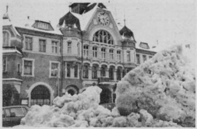
Sneg z mestnih ulic in trgov so najprej spravili na velike kupe, da so ga lahko potem z nakladalci nalagali na kamione in odpeljali.

Delali so do 22. ure, ponekod pa tudi do dveh po polnoči. V nedeljo, 20. decembra pa so začeli pluziti ceste, ki so uvrščene v drugo prioriteto, naslednji dan tretjo in tako naprej, ker je bilo treba začeti znova spričo ponovnega sneženja. Promet je bil sicer nekoliko oviran, vendar do večjih zastojev ni prišlo nikjer. Upajmo, da bo štab zimske službe s svojimi delavci, mehanizacijo in zalogami peska in soli enako uspešno obvladoval položaj vse do konca zimske sezone.