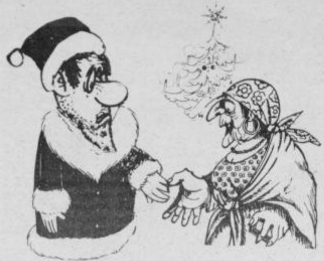
Tovarišica vedeževalka, povejte, kaj fepega naj mladim obljubim, da jim bo v letu 1982 tudi uresničilo?