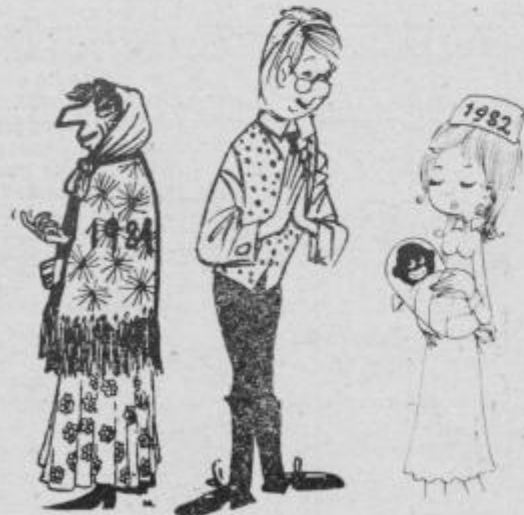
Oh ne, tako črno pa novo leto vendar ne bo!