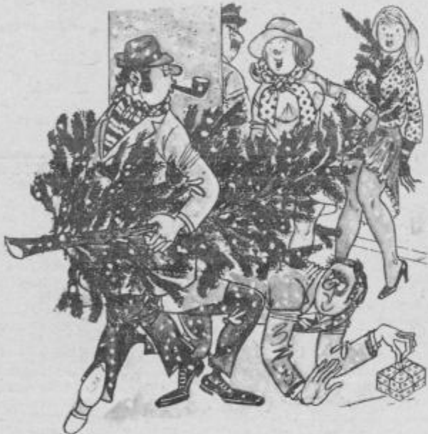
Tovariš, s svojo jelko pa segate nekoliko predalec ...