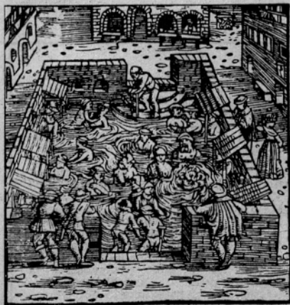
KOPALNIŠČE V 16. STOLETJU