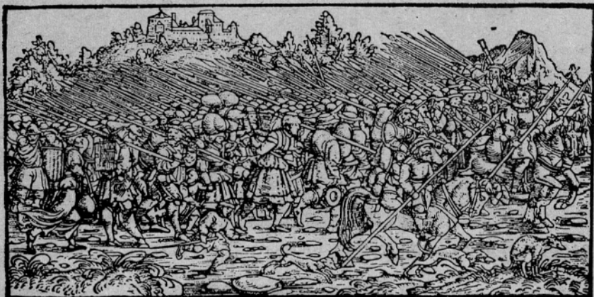
KMEČKA VOJSKA NA POHODU

je pojavila še velika množica puntarjev od savske strani.