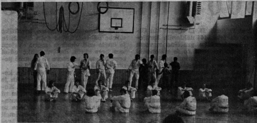
PRED ZACETKOM DVOBOJEV KARATEISTOV V HRVAŠKO-SLOVENSKI LIGI V RIMSKIH TOPLICAH

Rimske Toplice I., 5. Tovarna izolacijskega materiala TIM Laško, 6. Postaja milice Laško, 7. Osnovna šola A. Aškerc Rimske Toplice, 8. Slovenijales — Tovarna lesne galanterije Rimske Toplice II.