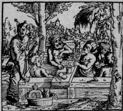
KOPALCI SE V 16. STOLETJU ZABAVAJO OB JEDACI, PIAČI IN GLASBI

slednika) so imeli reveži brezplačno kapanje in druge kopalniške usluge. Propagando za kapanje so v tistih časih zavili tudi v versko obliko. Naslikali so Kristusa, kako trobi na trobento skozi okno kopalnica, spodaj pa napisali: »Bog sam nam trobi na kapanje«. (Kopalničniki so namreč naznanjali odpiranje s trobljenjem, zvonjenjem ali udarci na gong.) Kapanje v tisti dobi pa ni imelo samo higienskega pomena; počasi se je namreč razvilo v pravo veseljačenje. Kopalci so si v bazen postavili mizo, na kateri so jedli, pili in igrali na srečo (kockali). Kopalniški mojster je poskrbel za glasbo in kapanje se je sprevrglo v pijačevanje. Kopalci so prihajali sčasoma