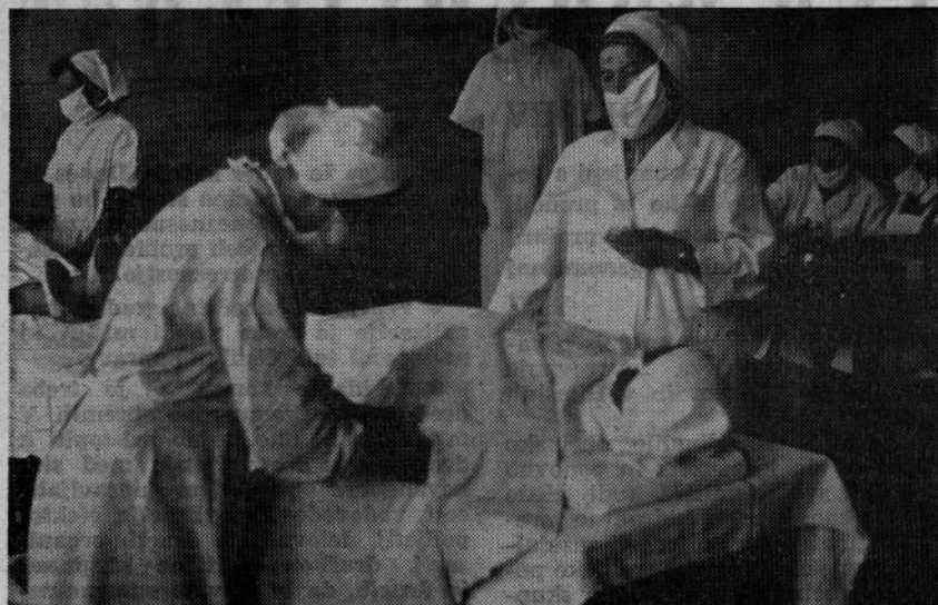
Z DAROVANO KRVJO REŠUJEMO ŽIVLJENJA IN ZDRAVJE SOOBCANOV

V letošnji junijski akciji je bilo predvidenih 200 krvodajalcev. Prijavilo se je 114 oseb, kri je dalo 105 oseb ali 52,5 % od predvidenih. Od predvidene količine 65.000,00 je bilo odvzete 32.335,00 (49,74 %).