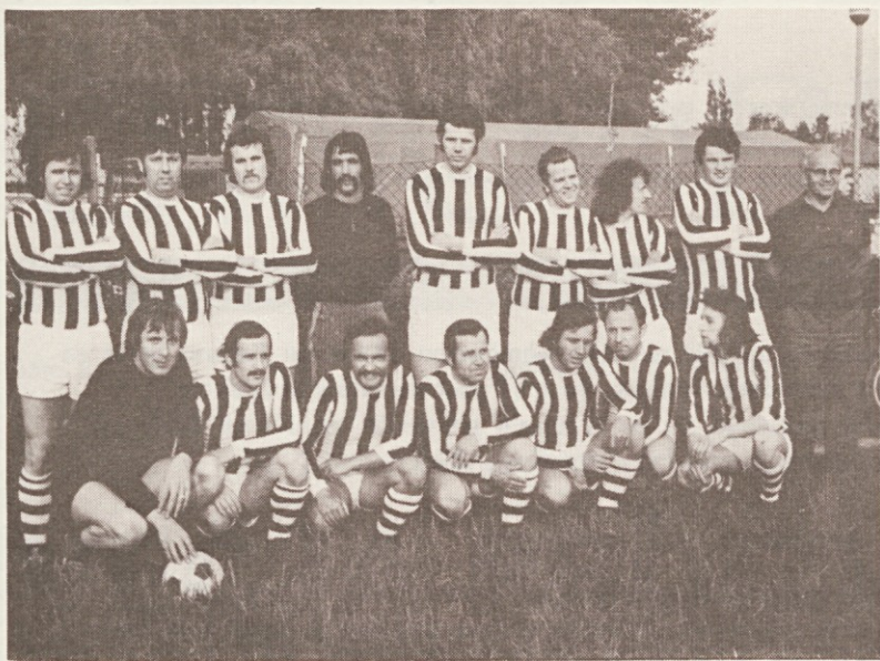
Nogometno moštvo tiskarne Ljudske pravice

Zelo radi bi videli, da bi imeli tudi nedelje plačane. Smo samo štirje korektorji in zaradi tega vsako četrto nedeljo dežuramo. Ni nujno, da nam bi plačali to delo ob nedeljah in prostih dnevih, ampak bi lahko to naredili tako, da bi pač korektorji imeli proste dneve, ki bi se prišteli k dopustu.“