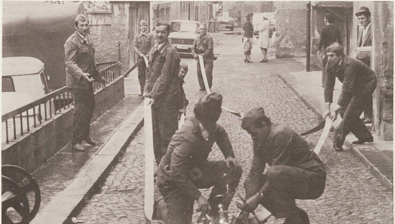
Gasilci Ljudske pravice med vajo

Ob koncu vaje je bila gasilski ekipi tiskarne LP, gasilcem gasilskega društva Ljubljana in enoti prve pomoči tiskarne izrečena pohvala. Vsi skupaj so obljubili, da se bodo še naprej trudili in izpopolnjevali za naloge, ki jih čakajo.