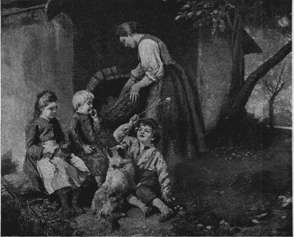
Mati z otroki.

Otroška soba je tedaj polna življenja, polna dela. Stol služi za voziček. Na njem leži poleno — to je bolan otrok. Za travnik služi preproga. Tu je skakanja in prekucevanja. Prazen zabojček je auto. Pod mizo v kotu ima ta auto svojo garažo. Tudi mamica mora sestri na auto in se odpeljati v daljna mesta. Seveda mora potem izčrпно poročati, kaj je videla v daljnih tujih krajih.