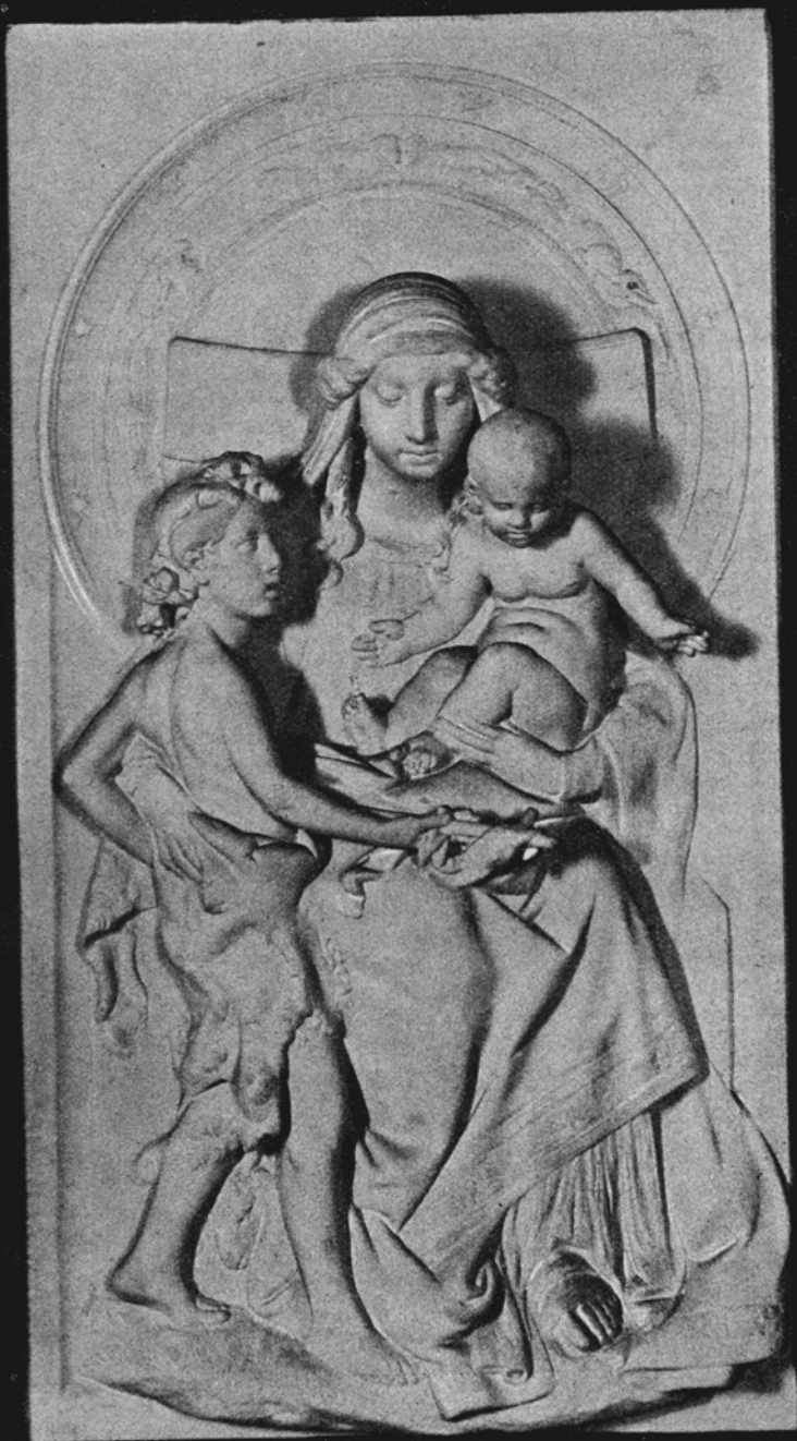
Mati Marija z Jezuščkom in Janezom.